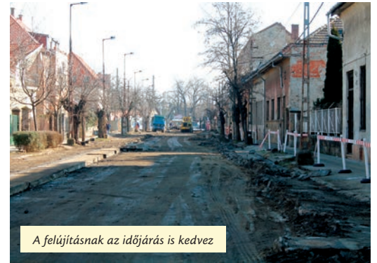
A felújításnak az időjárás is kedvez