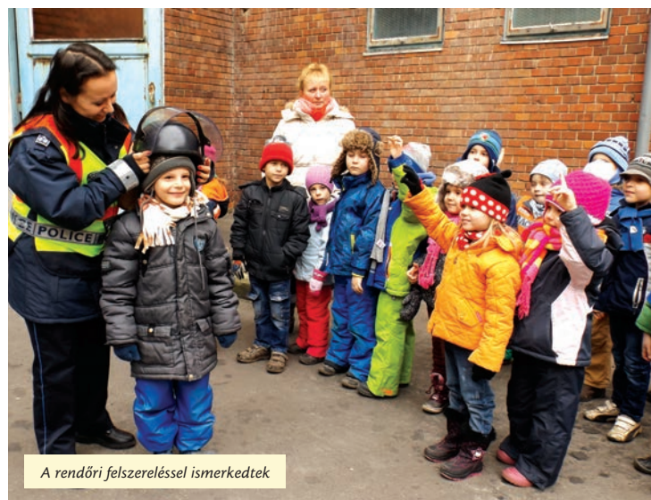
A rendőri felszereléssel ismerkedtek