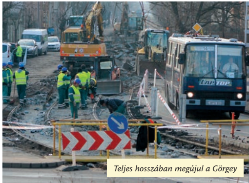
Teljes hosszában megújul a Görgy

A Görgy út teljesen megújul. A február elején indult munkálatok a bontási fázisban tartanak.