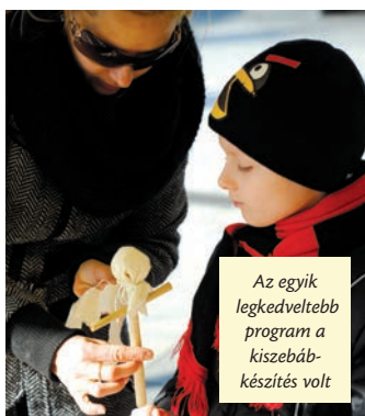
Az egyik legkedveltebb program a kislebáb-készítés volt