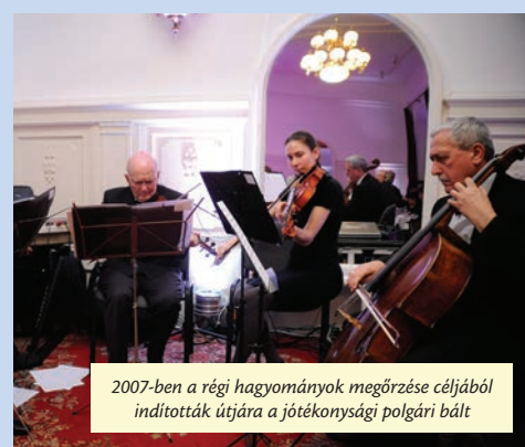
2007-ben a régi hagyományok megőrzése céljából indították útjára a jótékonyági polgári bált