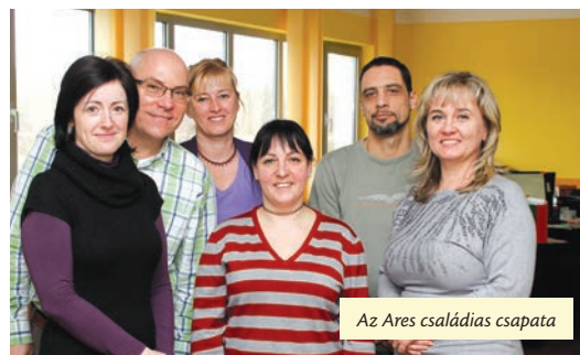
Az Ares családias csapata