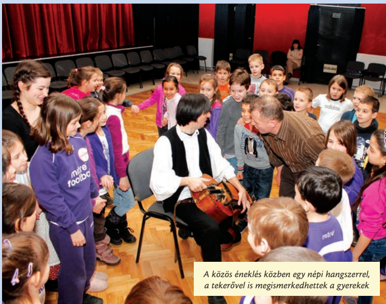
A közös éneklés közben egy népi hangszerral, a tekerővel is megismerkedhettek a gyerekek