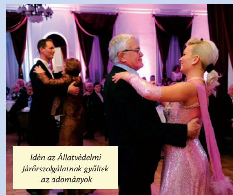
Idén az Állatvédelmi Járőrszolgálatnak gyűltek az adományok

Idén február 14-én rendezték meg a már hagyománnyá vált Polgári Bált a Polgár Centrumban.