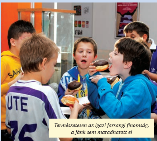
Természetesen az igazi farsangi finomság, a fánk sem maradhatott el