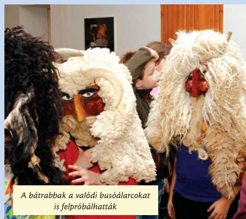
A bátrabbak a valódi busóálarokat is felpróbálhatták

Tánc, éneklés, kézműveskedés és jelmezverseny. Sűrű volt a lila-fehér Dorottya-bál programja, amelyet már hagyományosan az Ifjúsági Ház színháztermében rendeztek meg, február 10-én.