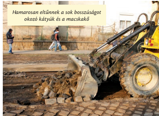
Hamarosan eltűnnek a sok bosszúságot okozó kátyúk és a macskakő