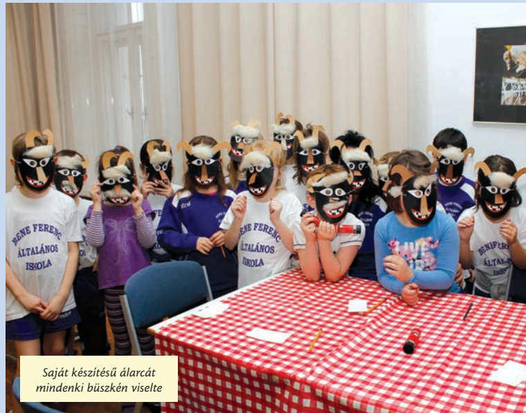
Saját készítésű álarcát mindenki büszkén viselte