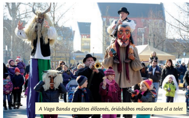
A Vaga Banda együttes élőzenés, óriásbábos műsora üzte el a telet