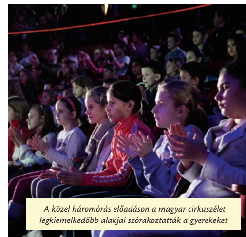
A közel háromórás előadáson a magyar cirkuszélet legkiemelkedőbb alakjai szórakoztatták a gyerekeket