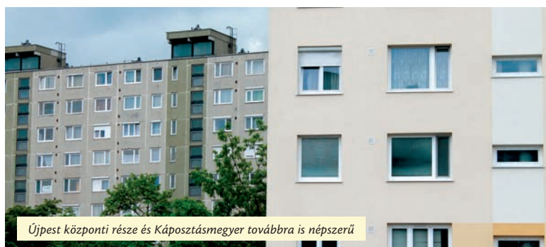
Újpest központi része és Káposztásmegyer továbbra is népszerű

Meglepően magas, közel 10 ezer adás-vétellel zárta az évet az ingatlanpiac 2014-ben – derül ki az egyik országos ingatlaniroda becsléseiből. A teljes évben több mint száz ezer tranzakció bonyolódott országszerte, és áremelkedés is megfigyelhető. Újpesten szintén emelkedtek a lakásárak. Százalékos arányban a panelekért kérnek többet, azonban a rezsicsökkentésnek és a jó közlekedésnek köszönhetően így is keresettebbek a téglalapítványúknál.