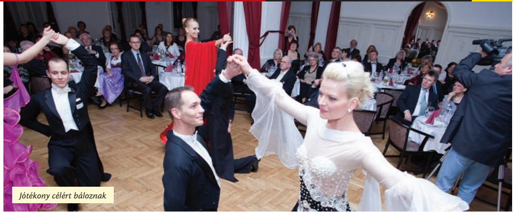
Jótékony célért báloznák

– Évente száz-százhuszan jönnek el a bálba, ahol nyitótáncsal, meleg vacsorával, pezsgővel, tomo-