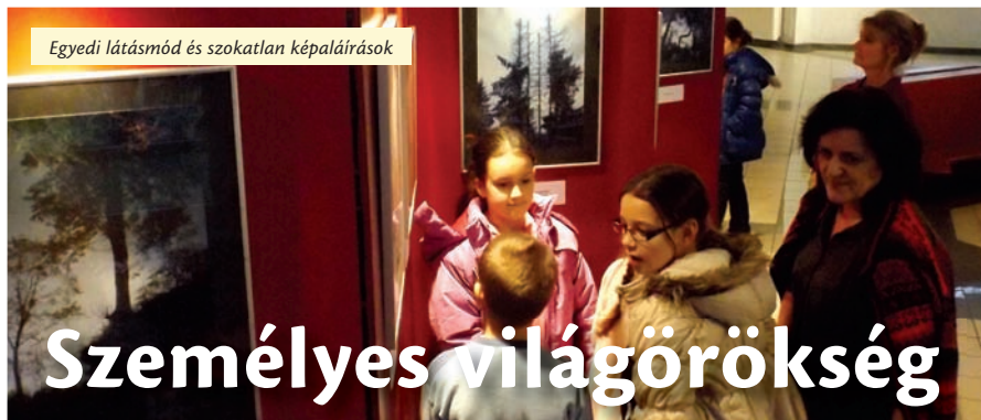
Egyedi látásmód és szokatlan képaláírások

Belépőt a 0620-8280514-es telefonszámon keresztül lehet rendelni. Időpont: 2015. február 14. szombat 19:30 (kapunyitás 19 óra) Helyszín: Újpesti Polgár Centrum, Árpád út 66.