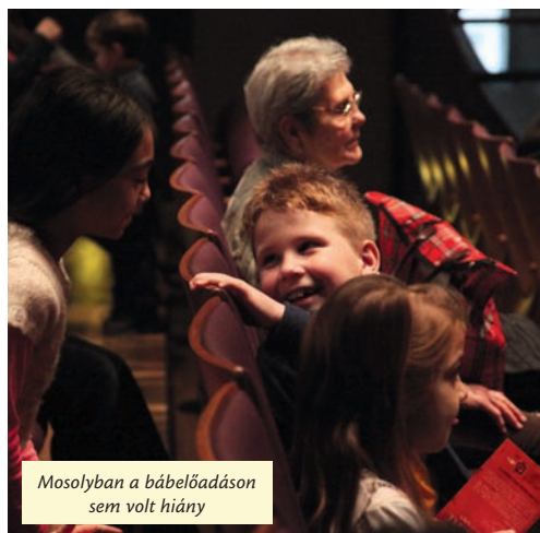
Mosolyban a bábelőadáson sem volt hiány

A Magyar Kultúra Napja, január 22-e, különleges élmény volt az Újpesti Cseriti által támogatott gyerekeknek. A nagyobbak a Magyar Cirkuszcsillagok című előadást nézték meg a Fővárosi Nagycirkuszban. A fiatalabb korosztály az idén százötven éves Vigadóba látogatott, a Szervusztok, pajtikák! című bábelőadásra.