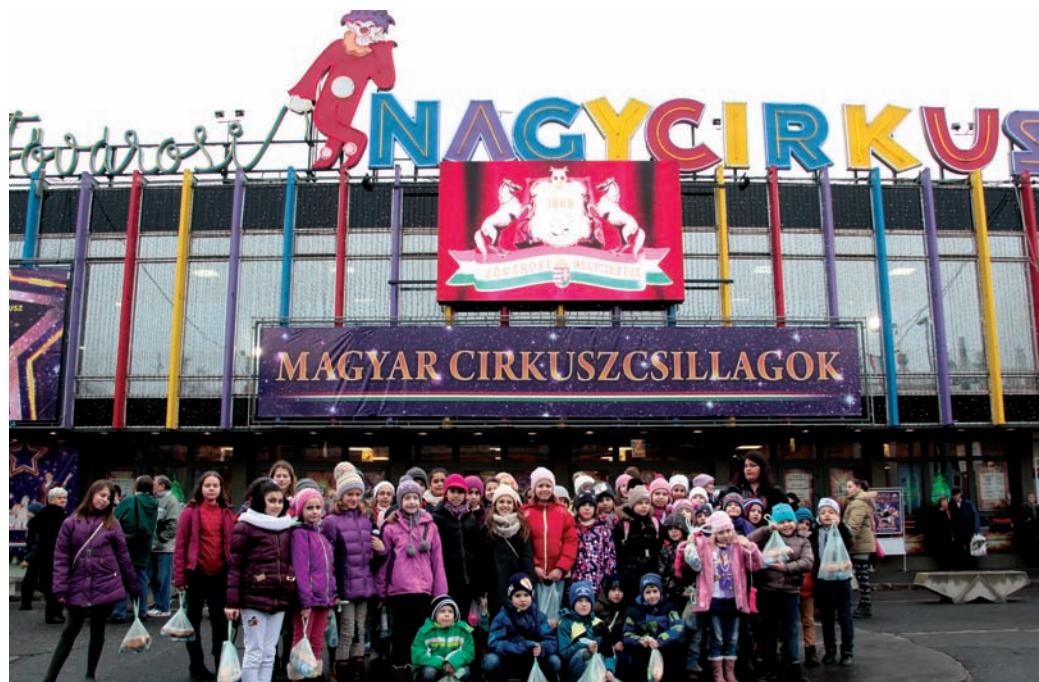
Vidám gyereksereg gyűlt össze a Fővárosi Nagycirkusz előtt

Sokan gondolják úgy, hogy az államnak, önkormányzatnak kötelessége segítenie a bajba jutottakon, legyen szó akár szegénységről, akár betegségről. De vajon a kötelesség mérlegelésekor mindenki eljutott már ahhoz a kérdéshez, hogy nekem, mint állampolgárnak, a közösség tagjának, nekem, mint magánembernek, mekkora a felelősségem a közös tehervállásban? A segítségnyújtás nem (csak) jogi kérdés. Nem paragrafusok határozzák meg. A segítségnyújtás „belső ügy”. Válasz egy egyszerű kérdésre: Miben segíthetnek? TALLÉR EDINA