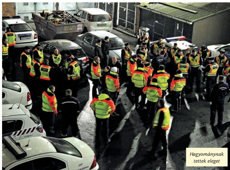
Hagyományak tettek eleget

Noha a fokozott ellenőrzés tényét a BRFK bejelentette, és a belvárosban is zajlott egy hasonló akció, az eredmények most is önmagukért beszélnek.