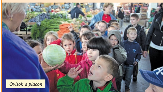
Ovisok a piacon