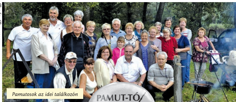
Pamutosok az ideji találkozón

– Régi kapcsolat a miénk az újpestiekkel. A nyolcvanas évek elején olvastam egy cikket egy napilapban, hogy a horgászegyesület helyet keres egy tó létesítésére. Mi örömmel fogadtuk őket, hiszen így rendbe tettek a korábban gazdátlan területet, és