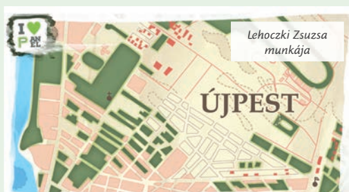
Lehoczki Zsuzsa munkája

Augusztus 18. és szeptember 15. között a FÖTÁV egy hónapon keresztül kereste a legkreatívabb városszinesítő ötletet és 485 beérkezett pályázati anyagból az első 50 legtöbb szavazatot kapott alkotásból választotta ki egy 6 tagú zsűri a nyertes