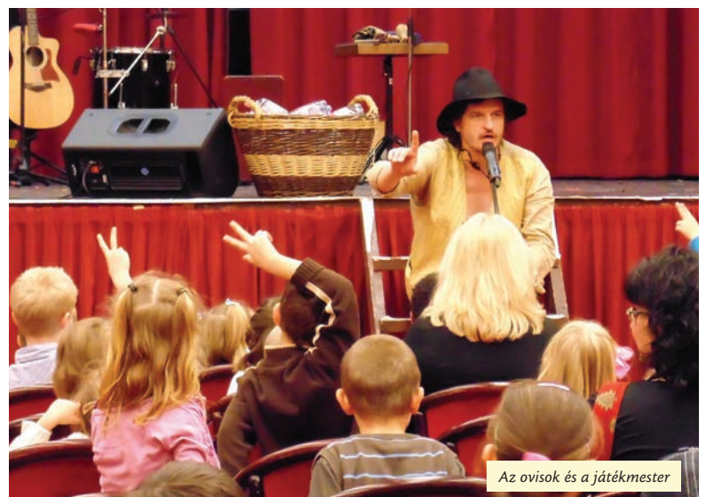
Az ovisok és a játékmester