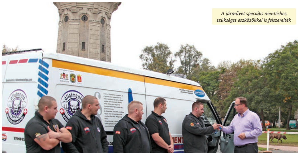
A járművet speciális mentéshez szükséges eszközökkel is felszerelték

A polgármester az autó átadásakor emlékeztetett: Újpesten alakult meg az ország egyetlen állatvédelmi járőrszolgálat, amely a helyi önkormányzattal és a rendőrséggel is együttműködik.