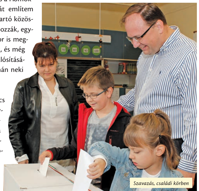
Szavazás, családi körben

Az itt élők akaratából megújítottuk a szakrendelőt, megépült a Halassy-uszoda, a négy évszacos sípálya, a Tarzan Park, a Szilas Park, megkezdődött a több évtizede épült lakótelepek zöld területeinek megújítása.