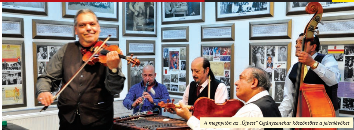
A megnyitón az „Újpest” Cigányzenekar köszöntötte a jelenlévőket

A Tél utcában átadták az Újpesti Roma Nemzetiségi Önkormányzat felújított és funkcióiban kibővített, a tanodának is otthont adó épületét. Ugyanitt megnyílt az Újpesti Cigány Helytörténeti Gyűjtemény.