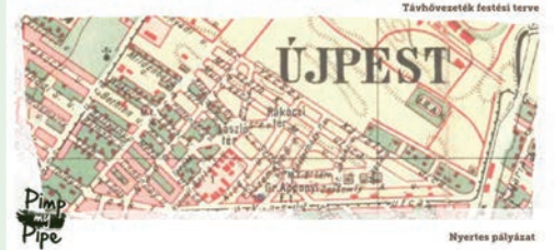
Távhővezeték festési terve