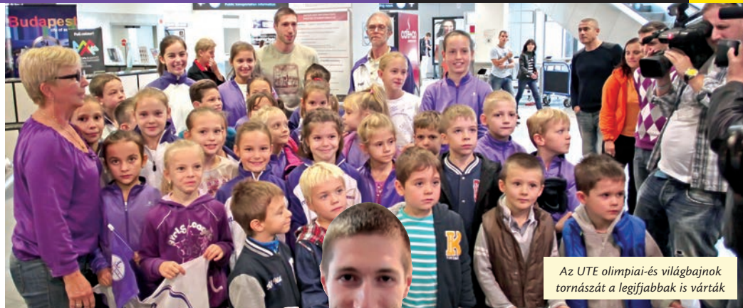
Az UTE olimpiai-és világbajnok tornaszát a legifjabbak is várták