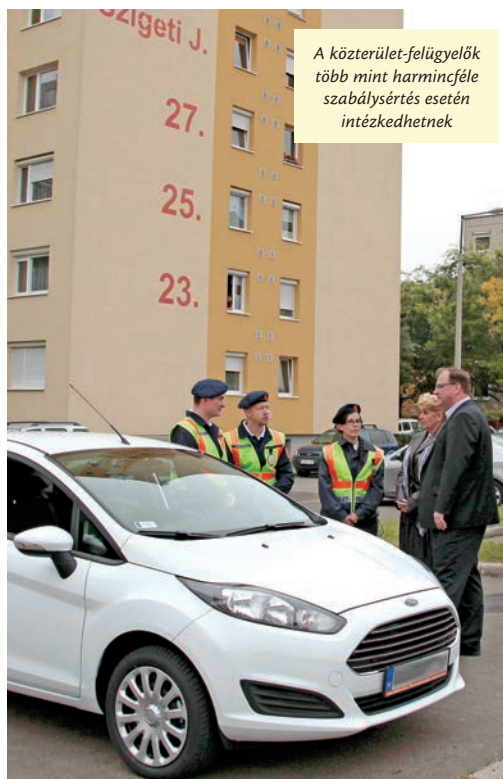
A közterület-felügyelő több mint harmincféle szabálysértés esetén intézkedhetnek

Kiemelte, feladataik közé tartozik többek között a rendezvények biztosítása, a közterületek rendjének védelme, a hulladékot illegálisan kihelyezők tettenérése,