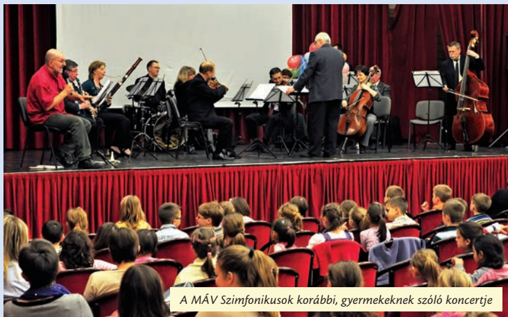
A MÁV Szimfonikusok korábbi, gyermekeknek szóló koncertje