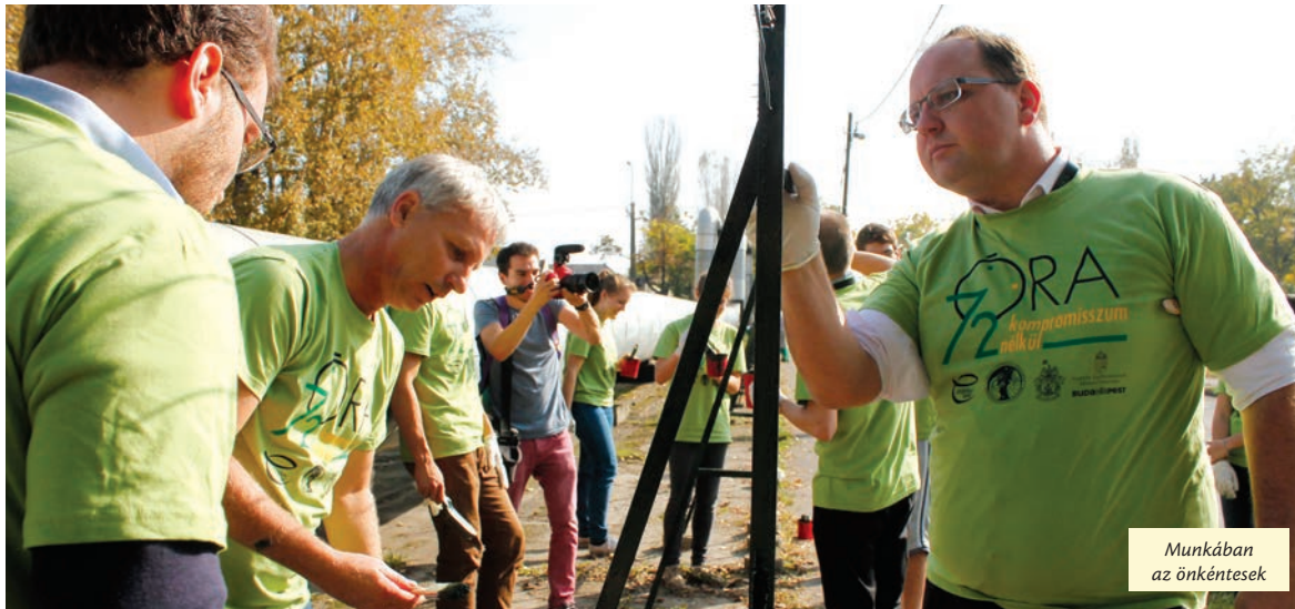
Munkában az önkéntesek