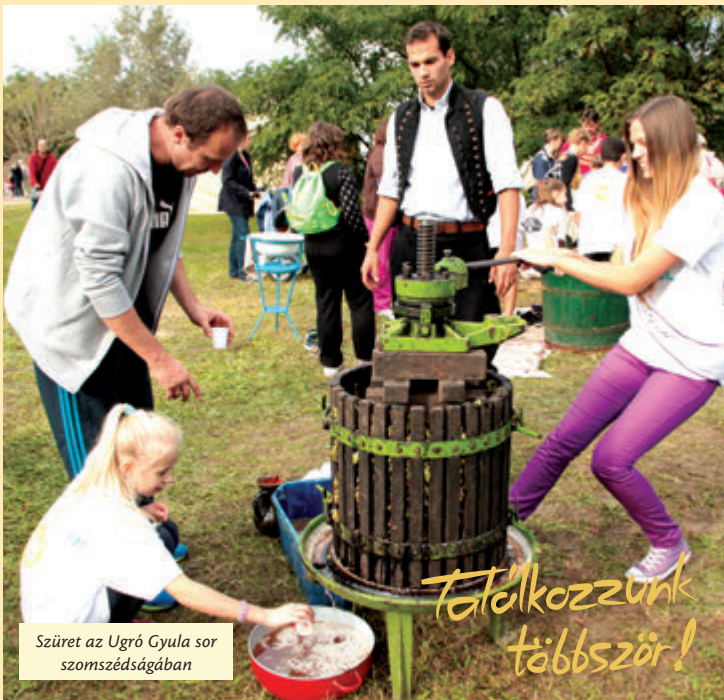
Szüret az Ugró Gyula sor szomszédságában