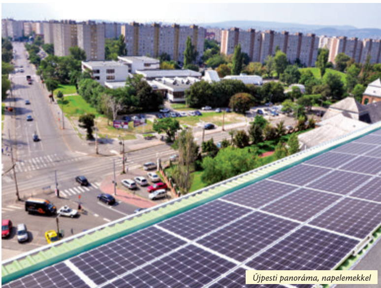
Újpesti panoráma, napelemekkel

Ebben az évben is számos fejlesztés történt az újpesti iskolákban. A kerékpáros közlekedést támogatandó biciklitámaszok épültek az óvodákhoz, iskolákhoz, több intézmény homlokzata megújult, másokban nyílászárókat cseréltek és szeptembertől mindenhol felújított ebédlőben étkezhetnek a gyermekek.