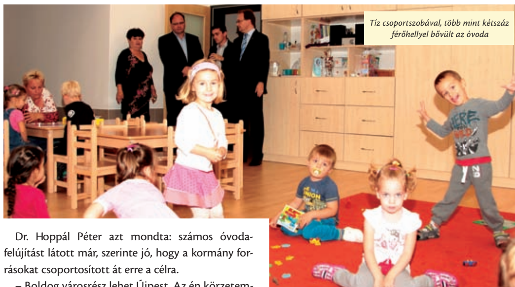
Tíz csoportszobával, több mint kétszáz férőhellyel bővült az óvoda

– A beruházás lebonyolítása, a kivitelező munkája példaértékű volt, bárcsak mindenhol így zajlana minden – zárta gondolatait.