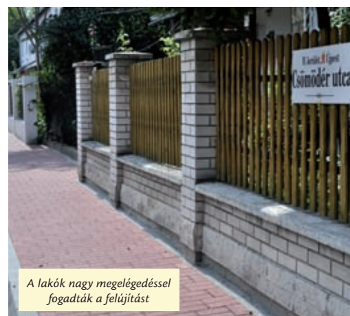
A lakók nagy meglepedéssel fogadták a felújítást

– Éppen minőség-ellenőrzést tartunk – mondja mosolyogva a nagypapa. – Az eredmény: kiváló! D. V.