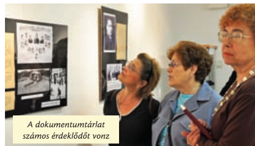
A dokumentumtárlat számos érdeklődőt vonz