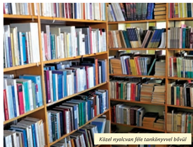
Közel nyolcvan féle tankönyvvel bővül