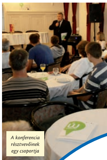
A konferencia részvevőinek egy csoportja