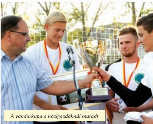
A vándorkupa a házigazdánál maradt

A polgármester a pálya átadása előtt a megmérkőző középiskolai csapatokat „sorsolta össze”. A Kanizsai Dorottya Egészségügyi Szakképző Iskola csapata a Babits Mihály Gimnáziummal, az Újpesti Könyves Kálmán Gimnázium teamje pedig az Újpesti Két Tanítási Nyelvű Műszaki Szakközépiskola és Szakiskola csapatával mérkőzött meg. A Károlyi-gimnázium a Benkő István Református Általános Iskola és Gimnázium csapatával, míg a házigazda a csokonaisokkal mérte össze erejét.