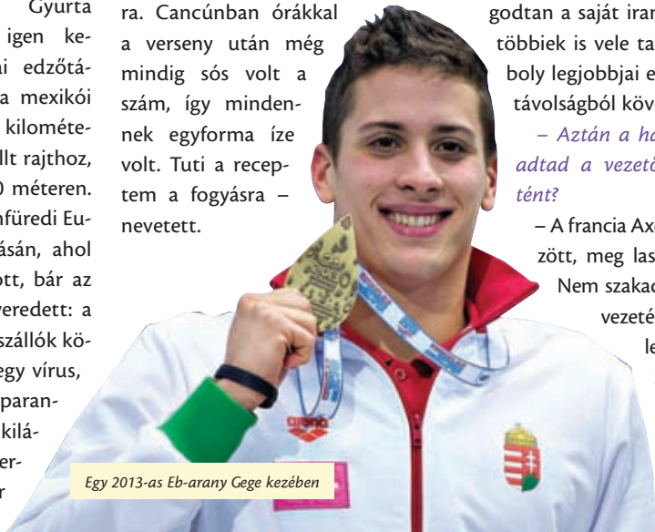
Egy 2013-as Eb-arany Gege kezében

– Általában két kiló simán lemegek, de például Mexikóban több mint három kilót vesztettem a súlyomból, igaz, ott nagyon meleg volt a tenger, harmincfokos. Ráadásul ilyenkor egy darabig még enni sem tud az ember, teljesen összehúzódik a gyomra. Cancúnban órákkal a verseny után még mindig sós volt a szám, így mindennek egyforma íze volt. Tuti a receptem a fogyásra – nevetett.