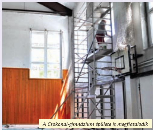
A Csokonai-gimnázium épülete is megfiatalodik