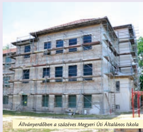
Állványerdőben a százéves Megyeri Úti Általános Iskola