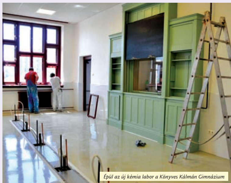
Épül az új kémia labor a Könyves Kálmán Gimnázium