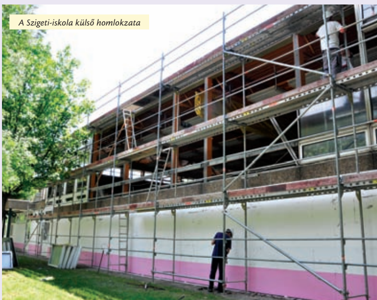
A Szigeti-iskola külső homlokzata