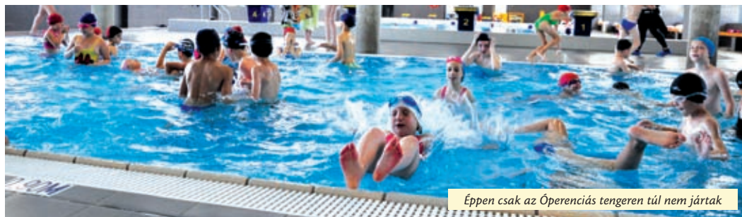
Éppen csak az Óperenciás-tengeren túl nem jártak