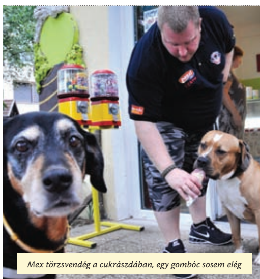
Mex törzsvendég a cukrászdában, egy gombóc sosem elég

Elsőként Újpesten jött létre tavaly az Állatvédelmi Járőrszolgálat. A rendőrkapitányság, Újpest Önkormányzata és az Állatmentő Liga együttműködésének célja, hogy az újpesti állatellenes cselekményeket kiemelten kezeljék. A három szervezet a bejelentések feldolgozásában, az intézkedésekben egymást segítve lép fel.