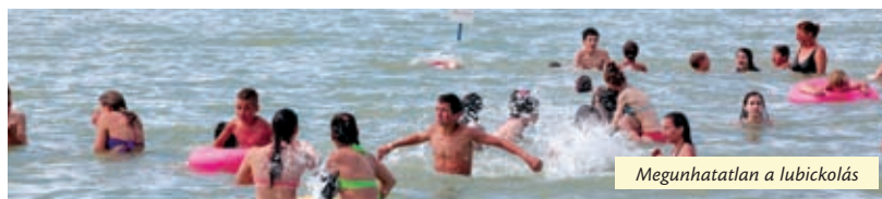
Megunthatlan a lubickolás