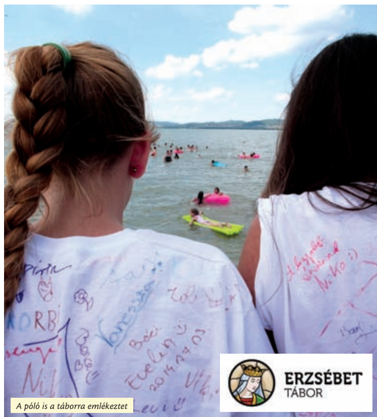
A póló is a táborra emlékeztet