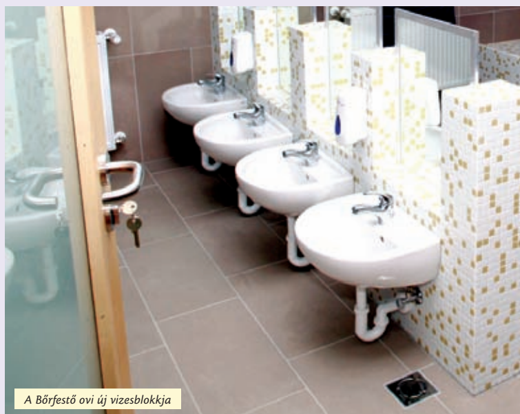
A Börfestő ovi új vizesblokkja