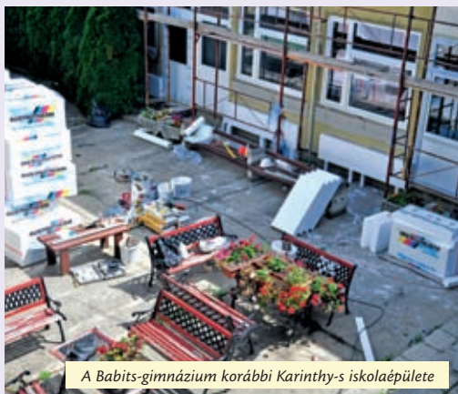
A Babits-gimnázium korábbi Karinthy-s iskolaépülete