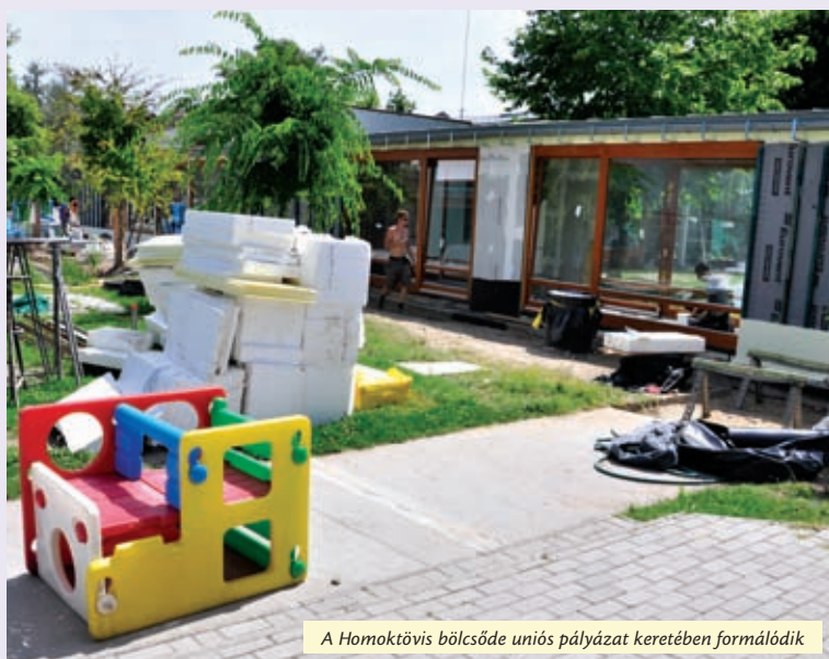
A Homoktövis bölcsőde uniós pályázat keretében formálódik

– Nyolc intézményben. A vakáció után örömteli megújulást tapasztalhatnak a diákok, a pedagógusok és a szülők például a Babits Mihály Magyar-