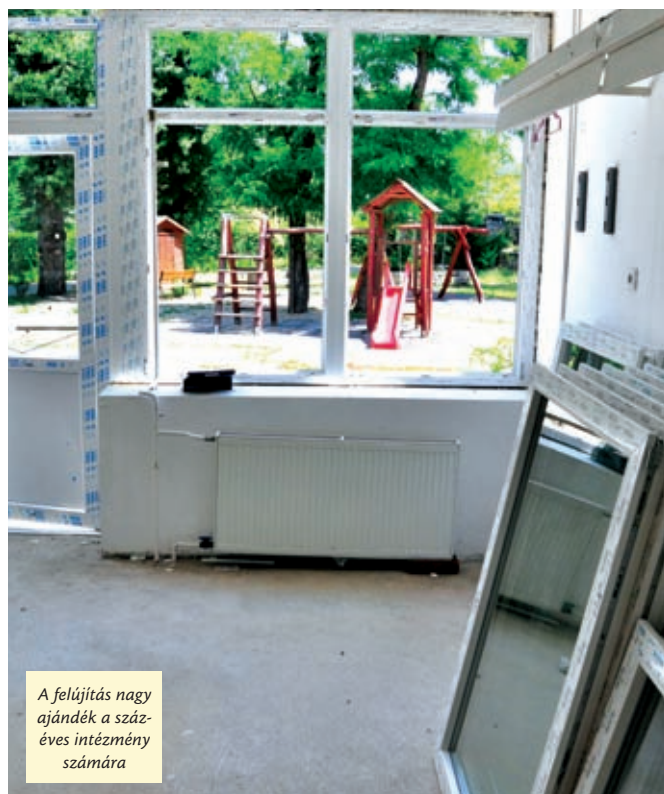
A felújítás nagy ajándék a százéves intézmény számára

Hozzátette: a nyári munkálatok idejére a tanulók hazavitték a folyosókat és az osztálytermeket díszítő növényeket, ökoiskola lévén ugyanis fontos, hogy a gyerekek nyáron is gondozzák azokat. Az intézményvezető szerint a felújítás nagy ajándék a kereken százéves intézmény számára.