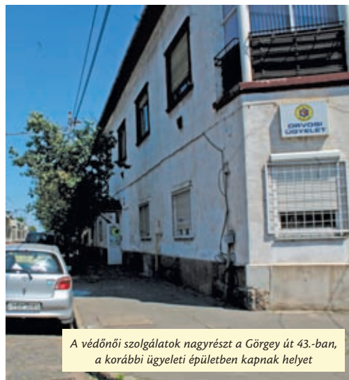
A védőnői szolgálatok nagyrészt a Görgy út 43.-ban, a korábbi ügyeleti épületben kapnak helyet

Újpest Önkormányzata ebben az évben megkezdte valamennyi gyermek- és felnőtt-háziorvosi rendelő felújítását. A munkálatok nyáron is folytatódhatnak, elsősorban a gyermekrendelőknél. A nagyobb munkálatok miatt június végétől elkerülhetetlen, hogy a rendelést másutt végezzék a háziorvosok és a védőnők. Az átmeneti kiköltözés miatt az önkormányzat a betegek türelmét és megértését kéri.