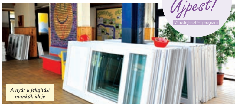
A nyár a felújítási munkák ideje