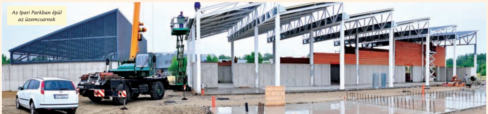
Az Ipari Parkban épül az üzemszarnok