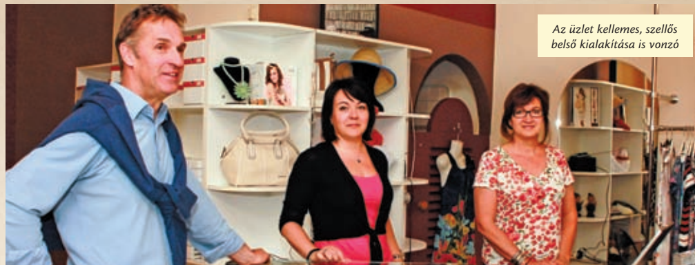
Az üzlet kellemes, szellős belső kialakítása is vonzó