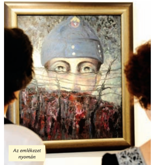
Az emlékezet nyomán