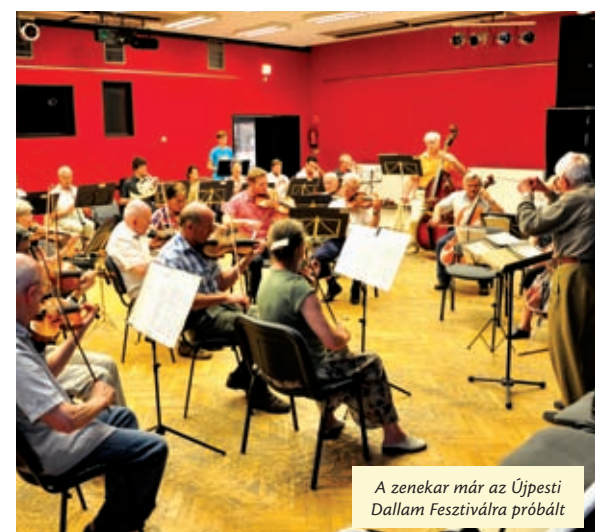
A zenekar már az Újpesti Dallam Fesztiválra próbált

A Dallam Fesztivál programsorozatában július 11-én, pénteken 17 órától a Duka Jazz lép fel a Károlyi parkban.