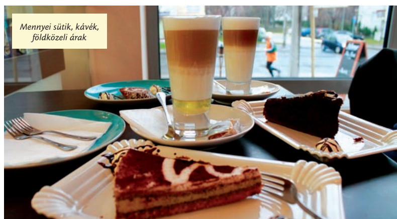
Mennyei sütik, kávék, földközeli árak

Mint ismert, lakossági kérés nyomán támogatta az önkormányzat az újpesti Piac-Placc létrejöttét. A standokon szombatonként minden otthon feleslegessé vált apróságot, használati tárgyat eladhatnak az erre vállalkozók, kivéve élelmiszert, vegyi árut, virágot vagy élő állatot. Az újpesti árusok 900, a máshonnan érkezők 1500 forintot fizetnek alkalmanként.