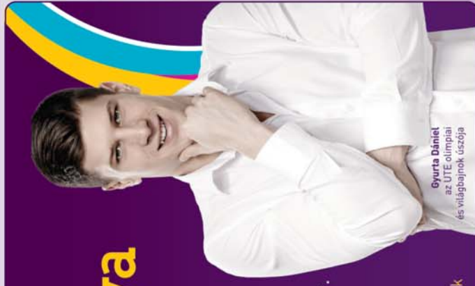
Gyurta Dániel az ÚTE olimpiai és világbajnok úszója