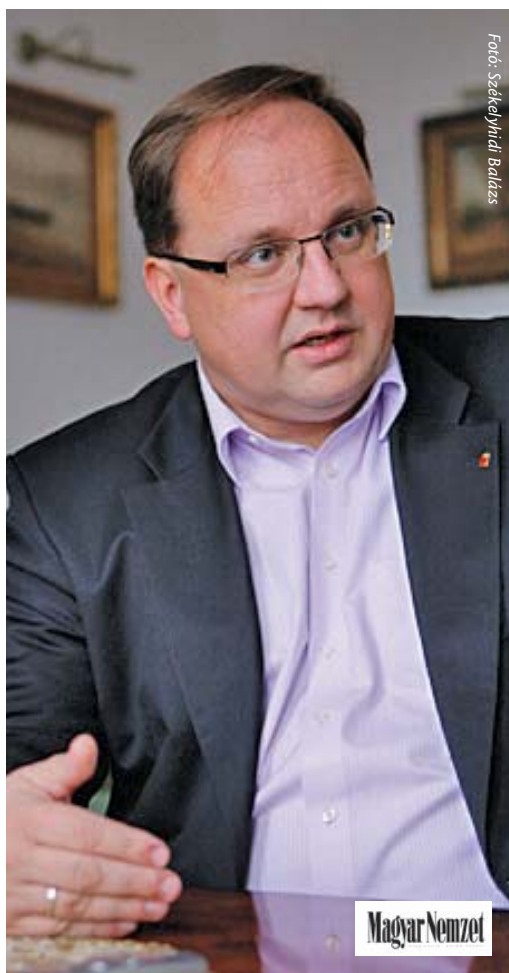
Fotó: Székelyházi Balázs