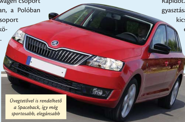
Üveg tetővel is rendelhető a Spaceback, így még sportosabb, elegánsabb

már jól ismerünk. A másik hárombenzines motor viszont már turbós. Az újabb, négyhengeres 1,2 literes gép 86 és 105 lóerővel készült, a benzines csúcsmoделlbe pedig 1,4 literes, 122 lovas TSI motort szerelnek. Dízelmoделlben pedig 1,6 literes, négyhengeres kapható 90 és 105 lóerős kivitelben. Az általunk tesztelt 105 lóerős, ezerkettes TSI motor sportosan, dinamikus mozgatta a közel 1200 kg ösztömegű Rapidot. Nagyon gazdaságos a fogyasztása, hiszen városi forgalomban kicsit több mint hat literrel megelégedett. A váltója a Volkswagen csoporttól megszkott precíz, finom szerkezet, nagyon rövid utakat jár be a váltókar. Ehhez a motorhoz hatsebességes verzió jár, amivel országúton, autópályán a dízelekkel vetekedő fogyasztást érhetünk el.