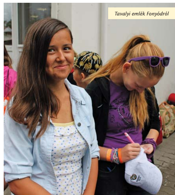
Tavalyi emlék Fonyódról