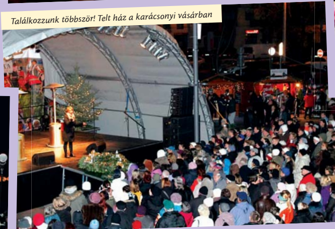
Találkozzunk többször! Telt ház a karácsonyi vásárran