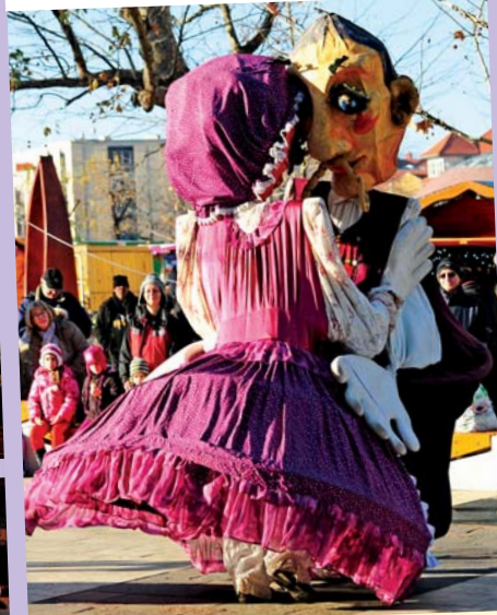
Kalapos, mesés történetek óriásbábokkal