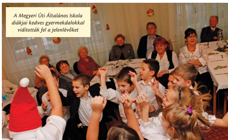
A Megyeri Úti Általános Iskola diákjai kedves gyermekdalokkal vidították fel a jelenlévőket

A Megyeri Úti Általános Iskolánál hagyomány, hogy felkeresik és köszöntik a környező idősothonok, nyugdíjasklubok lakóit, látogatóit ünnepek idején. Az iskola kisdíákjai nem először lepték meg az Őszkacsintó Idősek Klubjának nyugdíjasait sem. Ezúttal kedves gyermekdalokból összeállított karácsonyi műsorral léptek fel a közelgő ünnep alkalmából.