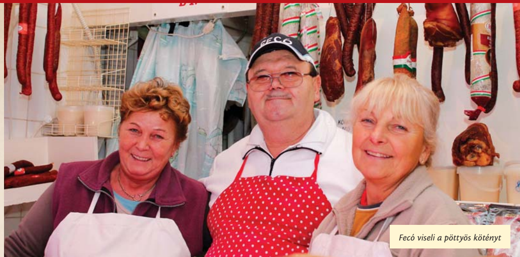
Fecó viseli a pöttyös kötényt

– Harmincöt évvel ezelőtt teljesen más volt az élet erre felé. Reggel fél hatkor már zörögtek a vevők, hogy nyissak ki, este fél hatkor pedig még