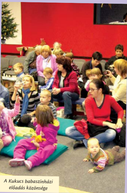
A Kukucs babaszínházi előadás közönsége