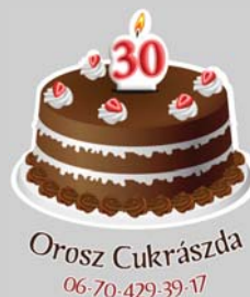
Orosz Cukrászda 06-70-429-39-17

KERESKEDELMI KÉPZÉSEK ÚJPESTEN Folyamatosan indítunk élelmiszer eladó, boltvezető, kereskedelmi ügyintéző, pénztáros képzéseket. Részletfizetés megoldható! Oktatás a délutáni órákban. Sikeres vizsga után mindenki OK.T. bizonyítványt kap. Jelentkezés: 06-20-951-3357