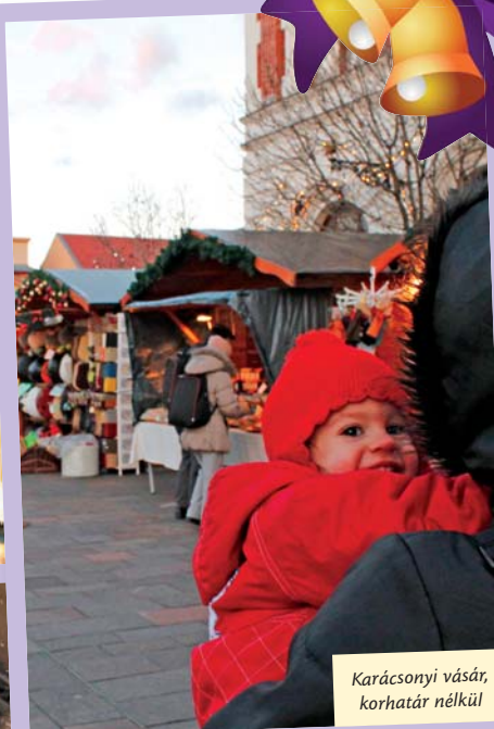
Karácsonyi vásár, korhatár nélkül