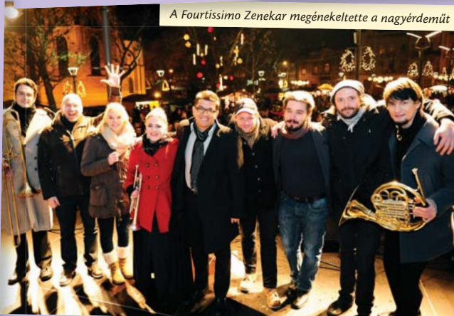
A Fourtissimo Zenekar megénekelte a nagyérdeműt