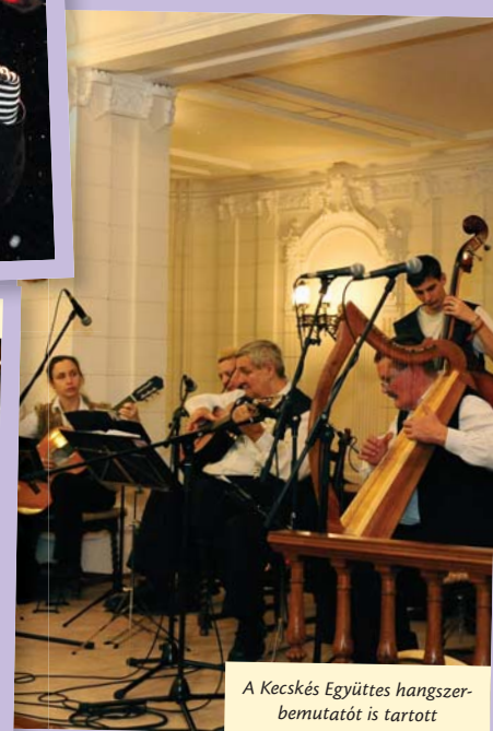
A Kecskés Együttes hangszerbemutatót is tartott