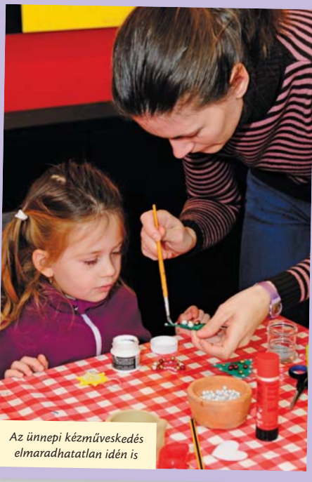
Az ünnepi kézműveskedés elmaradhatatlan idén is