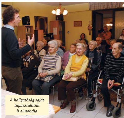
A hallgatóság saját tapasztalatait is elmondja

Az egyik kiemelt korcsoport az időseké, akiknek október utolsó napján tartottak először ilyen tájékoztatót a Baross utcában. A rákövetkező héten a Király utcai Bársonyszív Idősek Klubjában volt áldozatsegítő ismertető, ahol Nagy István alpolgármester azt mondta, hogy az önkormányzat nagy