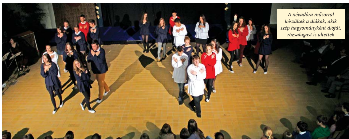
A névadóra műsorral készültek a diákok, akik szép hagyományként diófát, rózsalugast is ültettek