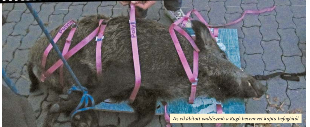
Az elkábított vaddisznó a Rugó becenevet kapta befogótól