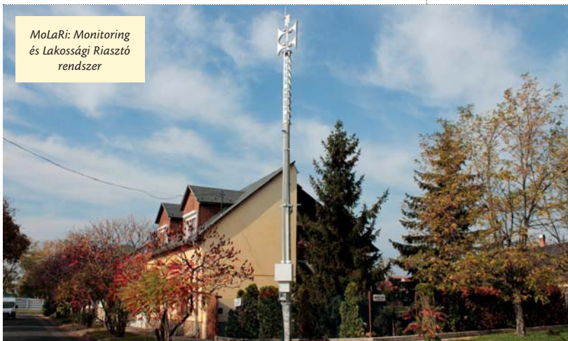
MoLaRi: Monitoring és Lakossági Riasztó rendszer