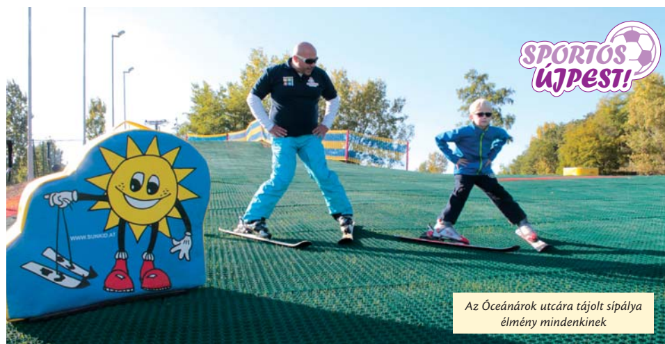
Az Óceánárok utcára tájolt sípálya élmény mindenkinek

Az árvácskák az egyházi virágok szíromhullása után, ősszel is színpompássá teszik a környezetünket.