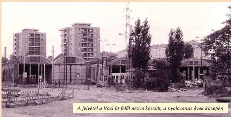
A felvétel a Váci út felől nézve készült, a nyolcvanas évek közepén

A metróépítéssel együtt járó területrendezés során 1990-re a kiürített épületet körbekerítették, előtte parkolót alakítottak ki. A kilencvenes évek közepétől megújult az egykori kocsiszín: új funkciójának köszönhetően azóta bevásárolhatunk falai között. Az üzlet portálját a világ számos táján futó villamosok képei díszítik. B. K.