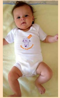
Hahóóó Újpest! 2013. május 21-én megérkezett Horváth Szofi!