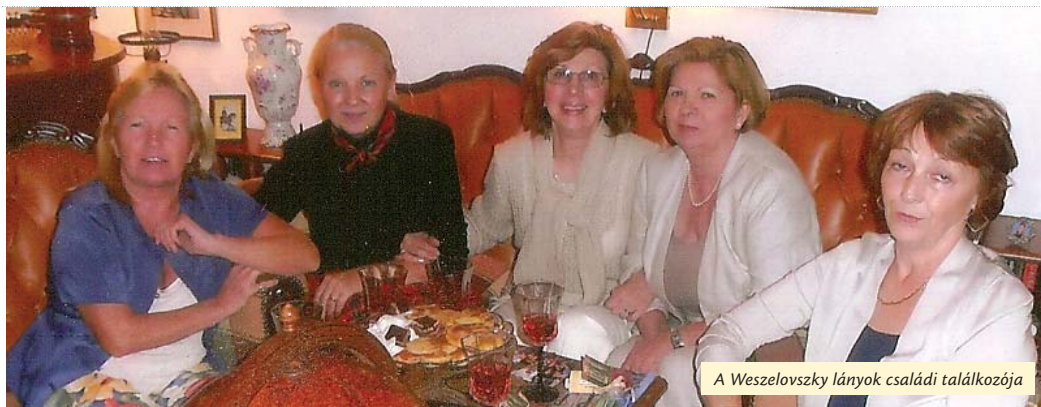
A Weszelovszky lányok családi találkozója

A rovat tanácsadó szakértői: Szöllősy Marianne és Krizsán Sándor helytörténész. Sorozatunkat kövess a www.facebook.com/ujpest.kapostasmegyert oldalon is!