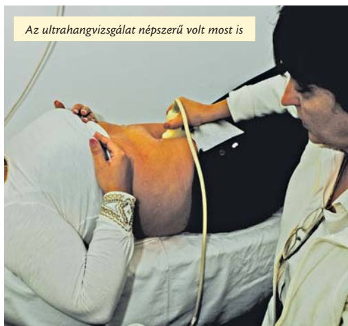
Az ultrahangvizsgálat népszerű volt most is

Több mint egytucatnyi szűrővizsgálat szerepelt a kínálatban, és bizony többen három-négyféle tesztet, vizsgálatot is elvégeztek állapotuk felmérésére. Az aulában többek között egészséges és bioélelmiszerek kóstolója és vására, auravizsgálat várta az érdeklődőket. Köllő Erzsébet például csontsűrűség- és érszűkület-vizsgálattal kezdte a napot, beszélgetésünk idején a bőrgyógyászati szűrővizsgálatra várt, de