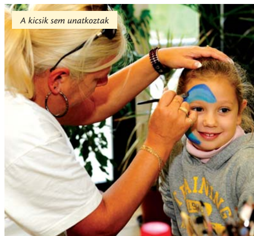
A kicsik sem unatkoztak

még tervezte a szemészeti ellenőrzést is: – Nekem nagyon fontos a személyes kapcsolat, s az, hogy kötetlenül lehet beszélgetni az orvosokkal, a nővérekkel. Jó a hangulat az épületben, nagyok sok az ismerős. Van, akivel már a korábbi egészségnapokon találkoztam, másokat eddig látásból ismertem, és most már személyesen is. Sze-