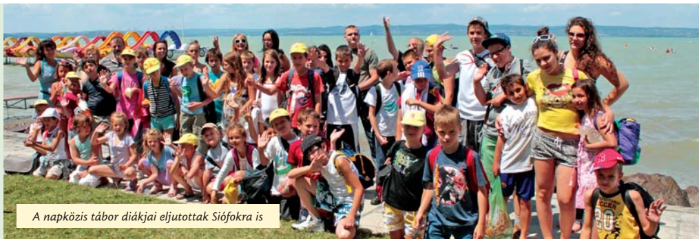
A napközis tábor diákjai eljutottak Siófokra is

Igaz, a nyár már csak a fotókról köszön vissza, ám hozzánk még folyamatosan érkeznek az önkormányzat szünet alatti napközis táboráról szóló élménybeszámolók, köszönőlevelek.