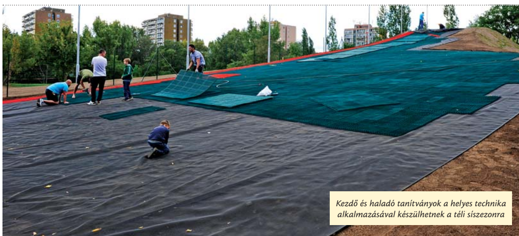
Kezdő és haladó tanítványok a helyes technika alkalmazásával készülhetnek a téli síszezonra