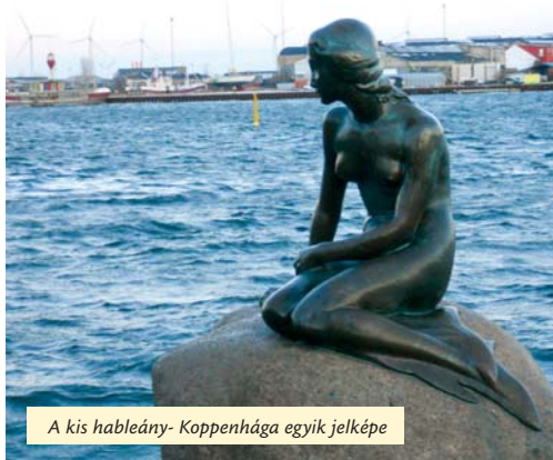
A kis hableány - Kopenhága egyik jelképe