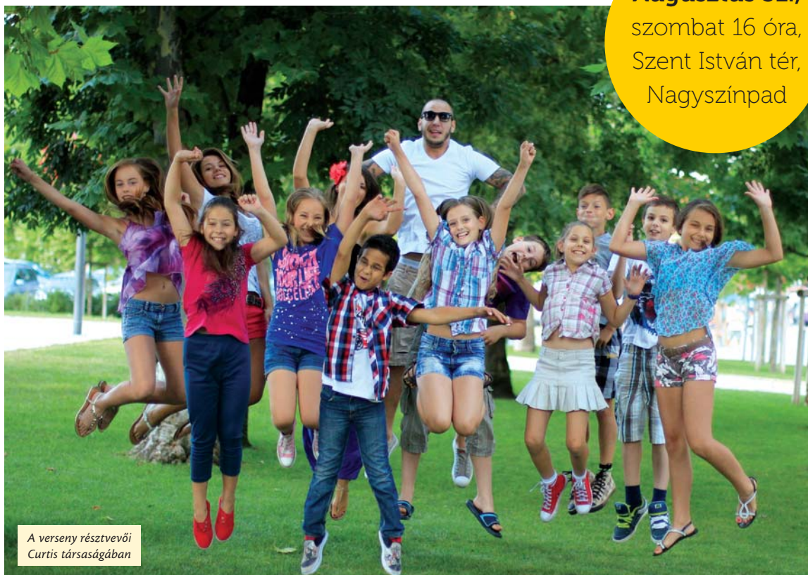
A verseny résztvevői Curtis társaságában

Hosszú hetek előzetes munkája, válogatások, elődöntők, beszélgetések és sok-sok színpadi próba után az Újpesti Városnapokon, augusztus 31-én, szombaton lépnek a nagyközönség elé az Újpest Arca szépségverseny döntősei. A helyi hírességekből álló zsűri hirdeti győztest. Idén is két korcsoportban, a 9–12 éves lányok és fiúk, valamint a 16–20 éves lányok közül választják ki Újpest Arcát, aki majd önkormányzati rendezvényeken képviseli a várost.