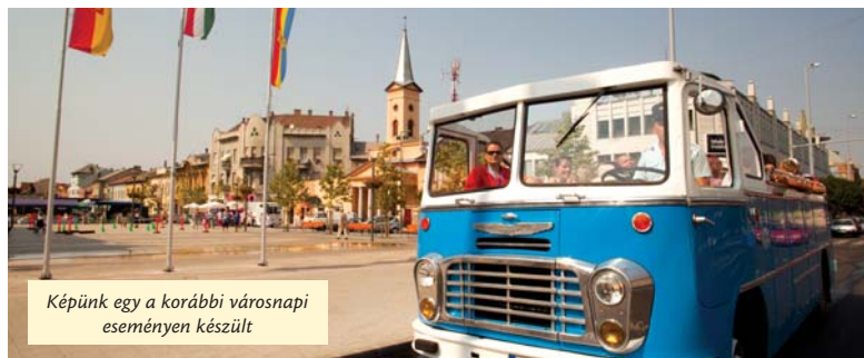
Képünk egy a korábbi városnapok eseményén készült