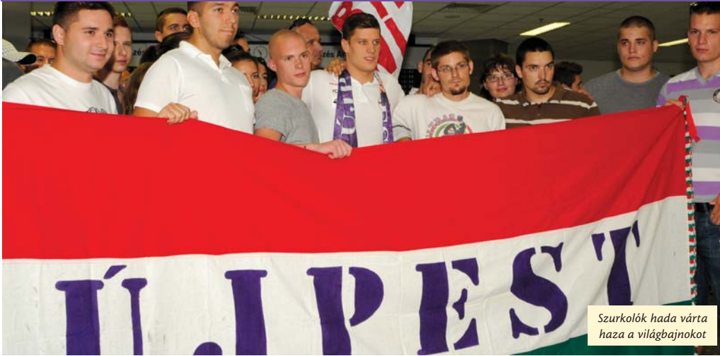
Szurkolók hada várta haza a világbajnokot