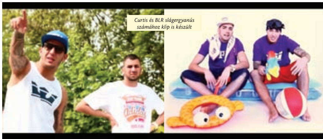
Curtis és BLR slágergyanús számához klip is készült