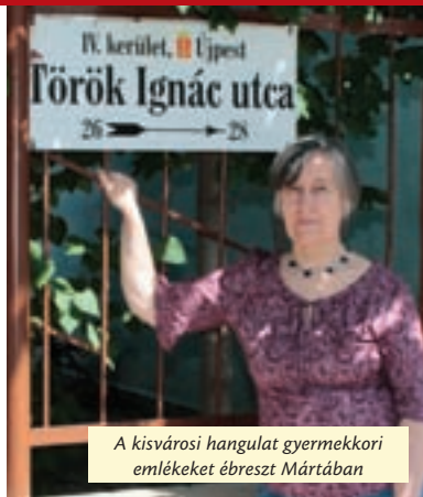
A kisvárosi hangulat gyermekkori emlékeket ébreszt Mártában

– Honvéd vezérőrnagy, hadimérnök volt, akit az aradi vértanúk egyikeként ítélték kötél általi halálra. Újpest egye-