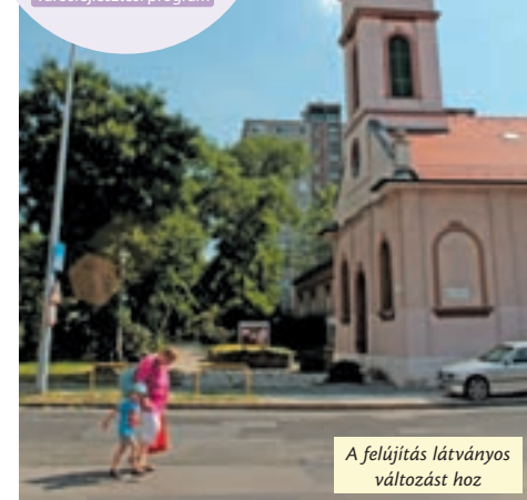
A felújítás látványos változást hoz

lajdonsága a vízáteresztő képessége, melynek köszönhetően a növények és a talajlakó élőlények számára is megfelelő körülményt biztosíthatunk.