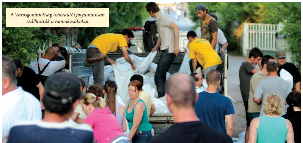
A Városgondnokság teherautói folyamatosan szállították a homokzsákokat

– Újpesten már túl vagyunk a veszélyen, itt helyben már a további teendőket elvégzik a szakemberek, és a hírek szerint a déli országrészben sincs szükség arra, hogy innen menjenek önkéntesek. Mindenki megtette a magáét, az újpestiek nagyszerűen helytálltak. Amikor itt nem volt szükség önkéntesekre, akkor nagyon sokan mentek át máshová segíteni, ahol arra szükség volt, Vácra, a Római-partra vagy a Margitszigetre. Önkéntes munkára tehát már nincs szükség, adományok azonban nyilván továbbra is jól jönnek a még folyó védekezéshez és a megkezdődő helyreállításokhoz. Szeretném megköszönni mindenkinek az összefogást, a munkát, helytállást, segítséget. A szakembereknek, az újpesti önkénteseknek, civileknek és cégeknek. Újpest ismét bizonyított. U. N.