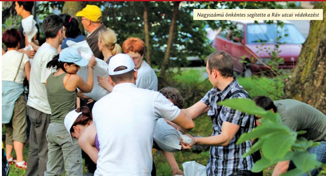
Nagyszámú önkéntes segítette a Ráv utcai védekezést

Önkormányzati rendezvényt nem kellett elhagyni, a Káposztásmegyer II.-n nyíló Megyeri Klub