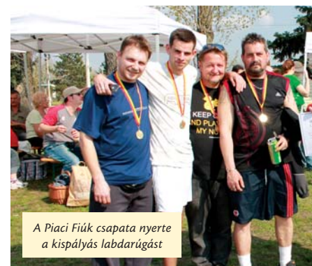
A Piaci Fiúk csapata nyerte a kispályás labdarúgást