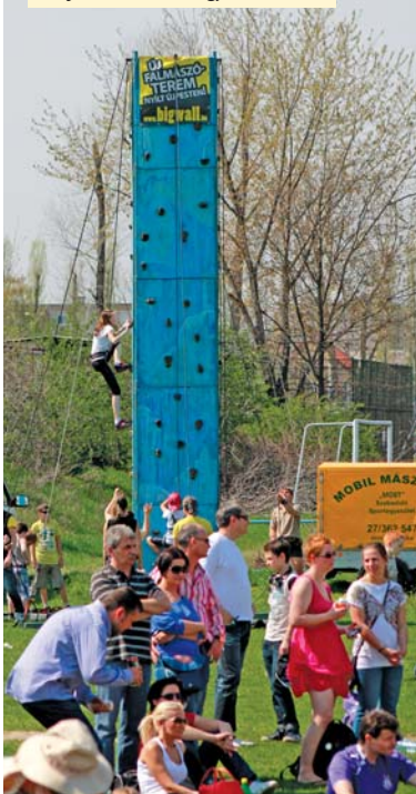
A falmászásnak nagy sikere volt

Újpest arcai sem unatkoztak a Tábor utcában. Bőszen osztogatták az önkormányzati rendezvényekre szóló programajánlókat, mi több, egy-egy