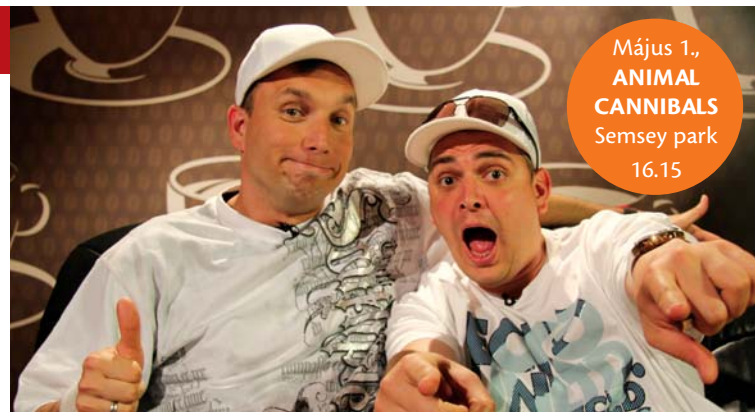
Május 1., ANIMAL CANNIBALS Semsey park 16.15

– Nehéz feladat, de csodálatos kihívás – mondta. – Ezért is várom már a majális, hiszen ott akár a nézők közé is lemehetek, nincsenek kööttségek. És énekelhetem, persze, csak ha akarja a publikum, akár a Dingdongot is! (gergely)