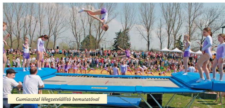
Gumiasztal lélegzetelállító bemutatóval