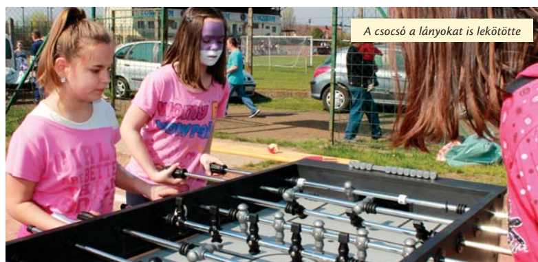
A csocsó a lányokat is lekötötte