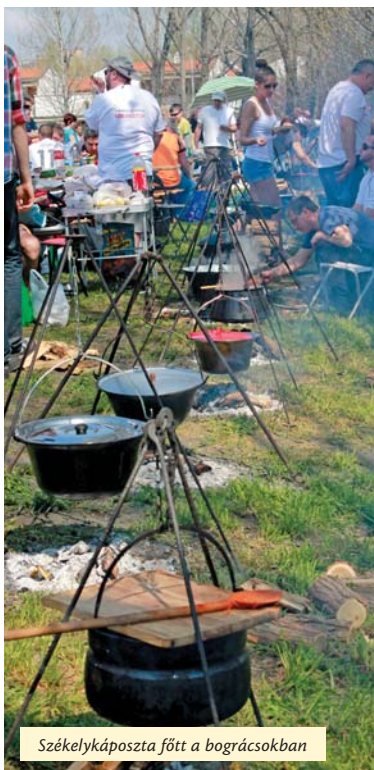
Székelykáposzta főtt a bográcsokban