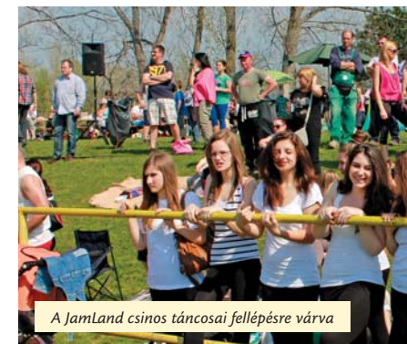
A JamLand csinos táncosai fellépésre várva