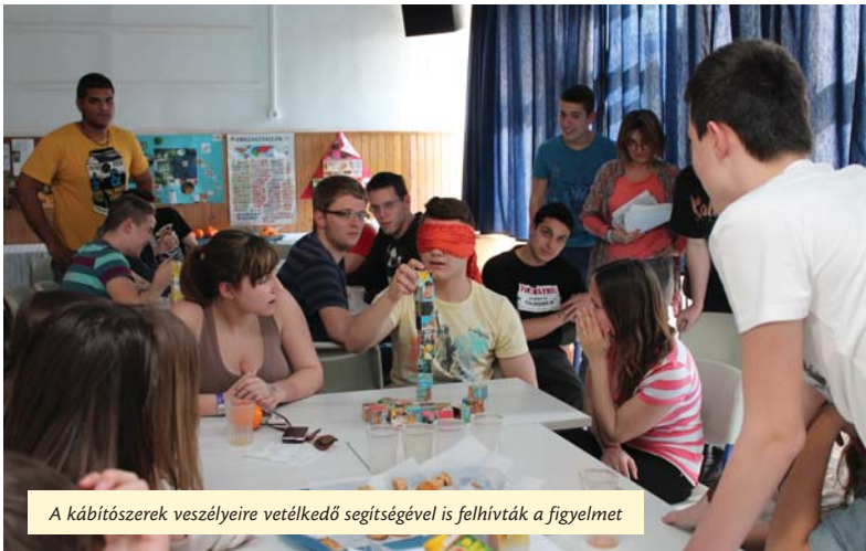
A kábítószer veszélyeire vetélkedő segítségével is felhívták a figyelmet