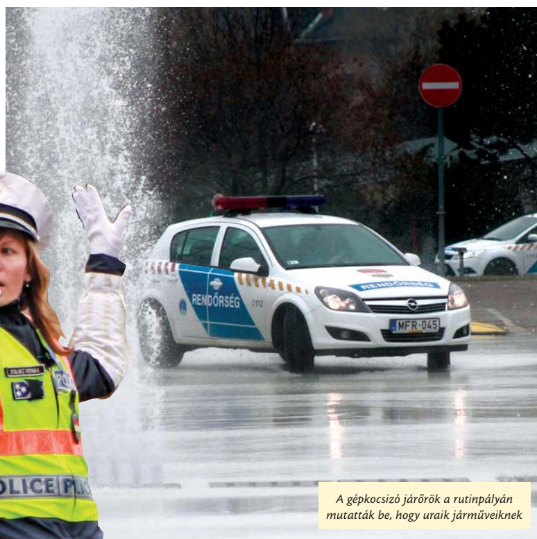
A gépkocsizó járőrök a rutinpályán mutatták be, hogy uraik járműveiknek

A versenyzők többségének az elméleti versenyszám jelentett nagyobb kihívást, azonban az a két egyenruhás, aki a legke-