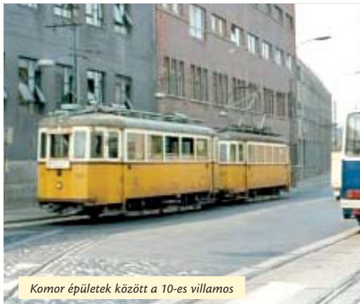
Komor épületek között a 10-es villamos

A 10-es a megállót elhagyva nagy ívbén és némi sín-csikordulással jobbra kanyarodott Újpest egy másik je-