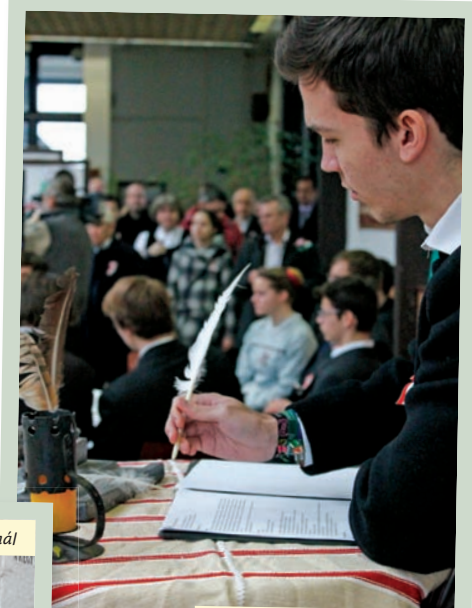
A Babits Mihály Gimnázium diákjai remekeltek műsorukkal