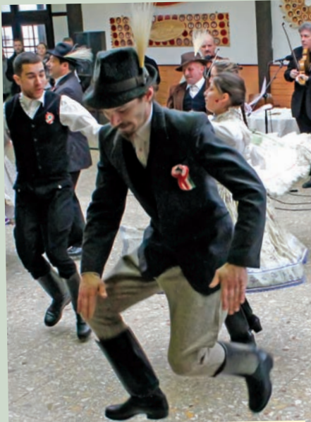
A Bem Táncgyűttes a városközponttól az ünnepség helyszínéig toborozta táncával az újpesti közönséget