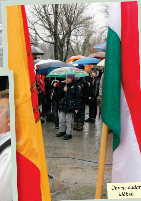
Ünnep, cudar időben