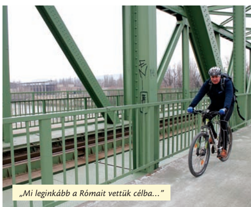
„Mi leginkább a Rómaid vettük célba...”

És a két nagy, sárga házban laktak a lányok, a hajdanvolt diákrajongások. Bármikor fel tudom