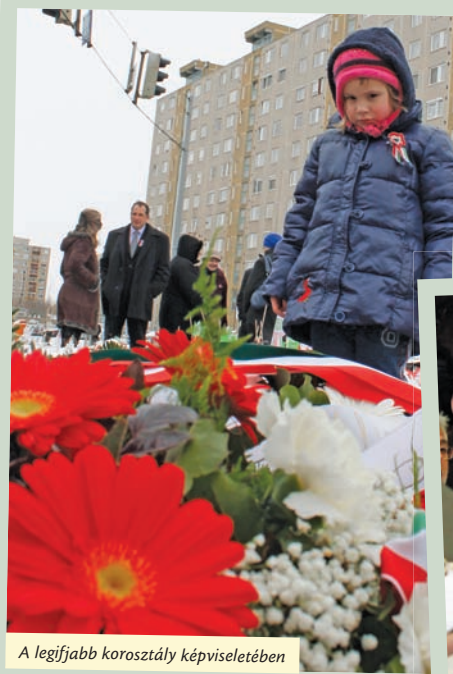
A legifjabb korosztály képviselőjében