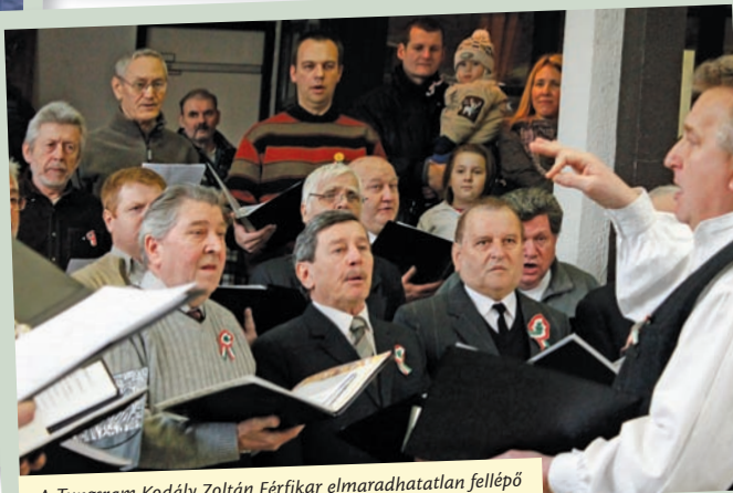
A Tungram Kodály Zoltán Férfikar elmaradhatatlan fellépő