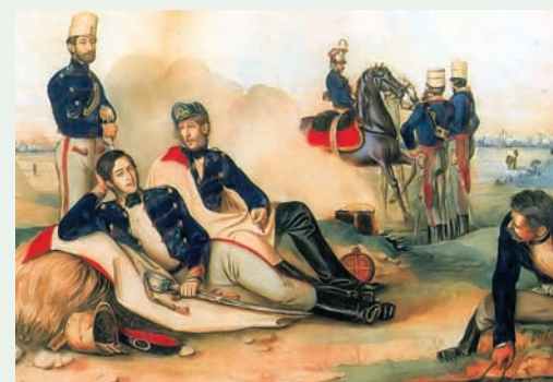
Thran Mór: Pihenő Károlyi-huszárok

Mint a forrásokból megtudjuk: Károlyi István gróf anyagi helyzete nem volt a legszerencsésebb ebben az időben. Ekkor alakította át Ybl Miklós-