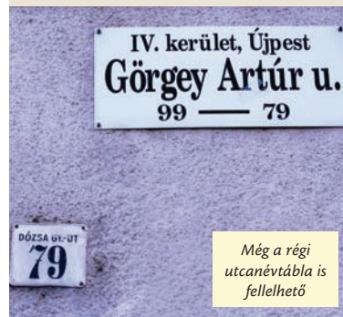
Még a régi utcanévtábla is fellelhető

Idézzük az Újpesti utcanévtaxikont: „Görgey Artúr utca (1991, előzőleg Dózsa György út, 1945, Horthy Miklós út, 1926, Vasút utca, 1880). Klauzál utca 1-től a Szilágyi utca 16-ig. Görgey Artúr (1818–1916) honvéd tábornok volt.