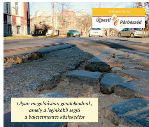
Olyan megoldásban gondolkodnak, amely a leginkább segíti a balesetmentes közlekedést

Megtudtuk azt is: egyelőre még nem dönt el, szakaszosan vagy egyszerre végzik-e a felújítást, és az is később körvonalazódik, hogy a munkálatok idejére milyen forgalmi változtatásokat kell bevezetni.