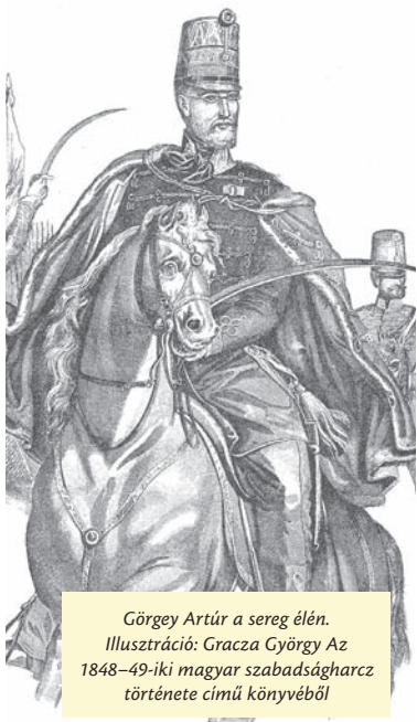
Görgey Artúr a sereg élén. Illusztráció: Gracza György Az 1848–49-iki magyar szabadságharc története című könyvéből

Újpesten közel háromszáz elnevezett közterületet találunk. Az utcanévadás kapcsolatban van a tájjal, a főbb közlekedési irányvonallal, ipari, kereskedelmi tevékenységgel, vagy híres embereknek állít emléket velük az utókor. Sorozatunkban arról kérdeztük az újpestieket, tudják-e, ki-ről, miről neveztek el azt az utcát, ahol otthonuk található.