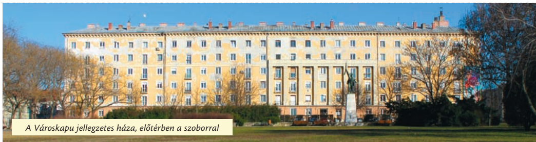
A Városcsúcs jellegzetes háza, előtérben a szoborral

Innen, a ház előtti megállóból indulva a 10-es elhagyta jobb felől a Berzeviczy utca sarkát, a pinceborozó és a Népfürdő látványával, távolabb sejtetve a gyönyörű zsinagógát, amely nekünk, gyerekeknek