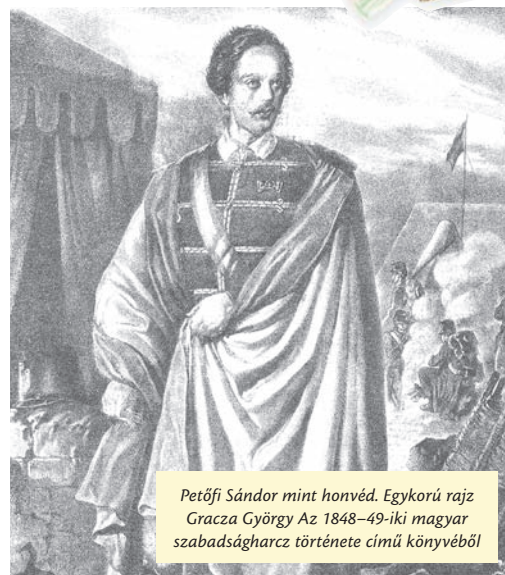
Petőfi Sándor mint honvéd. Egykorú rajz Gracza György Az 1848–49-iki magyar szabadságharc története című könyvéből

Az első körben a diákok a Petőfi Irodalmi Múzeumot keresték fel, ahol megtekintették a költő születésének 190. évfordulójára rendezett „Ki vagyok én? Nem mondom meg...” Petőfi választásai című kiál-