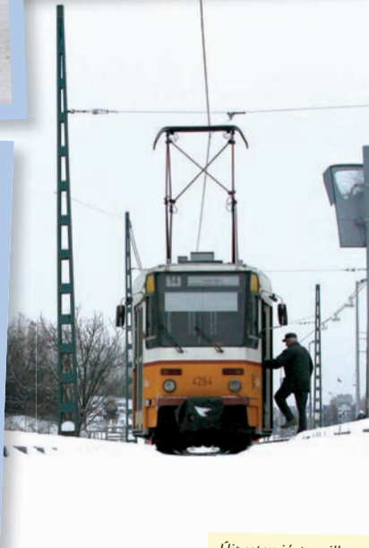
Újpesten járt a villamos