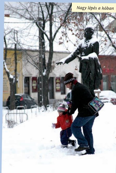
Nagy lépés a hóban