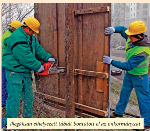
Illegálisan elhelyezett táblát bontott el az önkormányzat

A családi házak, társasházak előtti járdákon az ingatlanok tulajdonosainak kell gondoskodni a síkosságmentesítésről. Ha azért történik baleset, mert egy tulajdonos nem takarította le a járdát, kártérítési kötelezettsége, felelőssége keletkezik. Amennyiben a városgondnokságnak marad rá kapacitása, egy-egy olyan járdaszakaszt is megtisztít, ami eredetileg nem feladata.