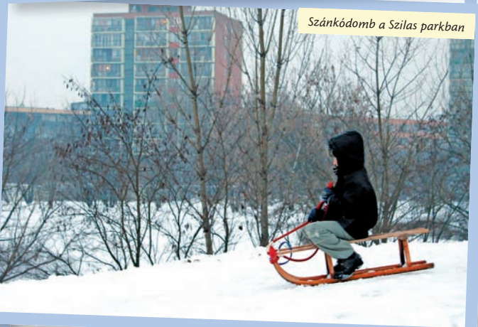
Szánkódomb a Szilas parkban