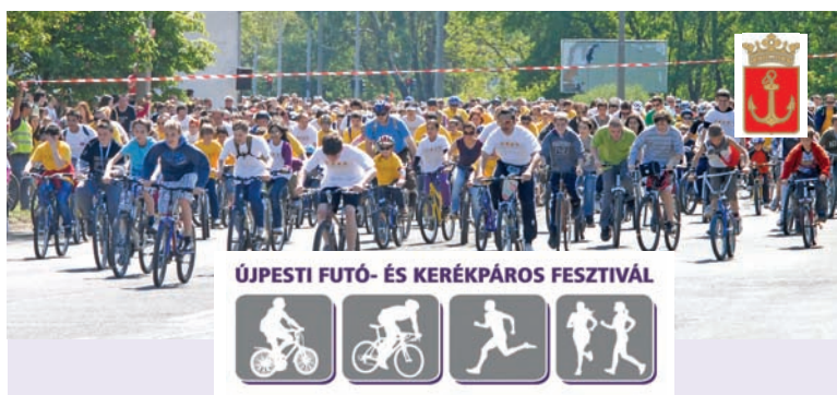
ÚJPESTI FUTÓ- ÉS KERÉKPÁROS FESZTIVÁL