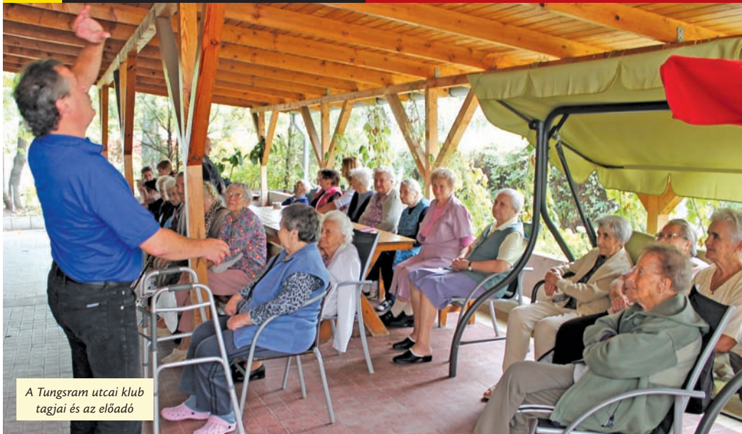
A Tungsram utcai klub tagjai és az előadó