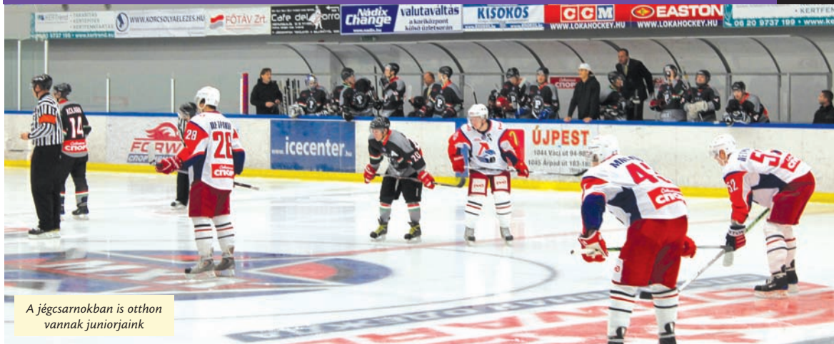
A jégcsarnokban is otthon vannak juniorjaink