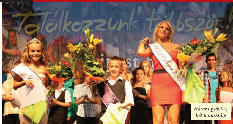
Három győztes, két korosztály