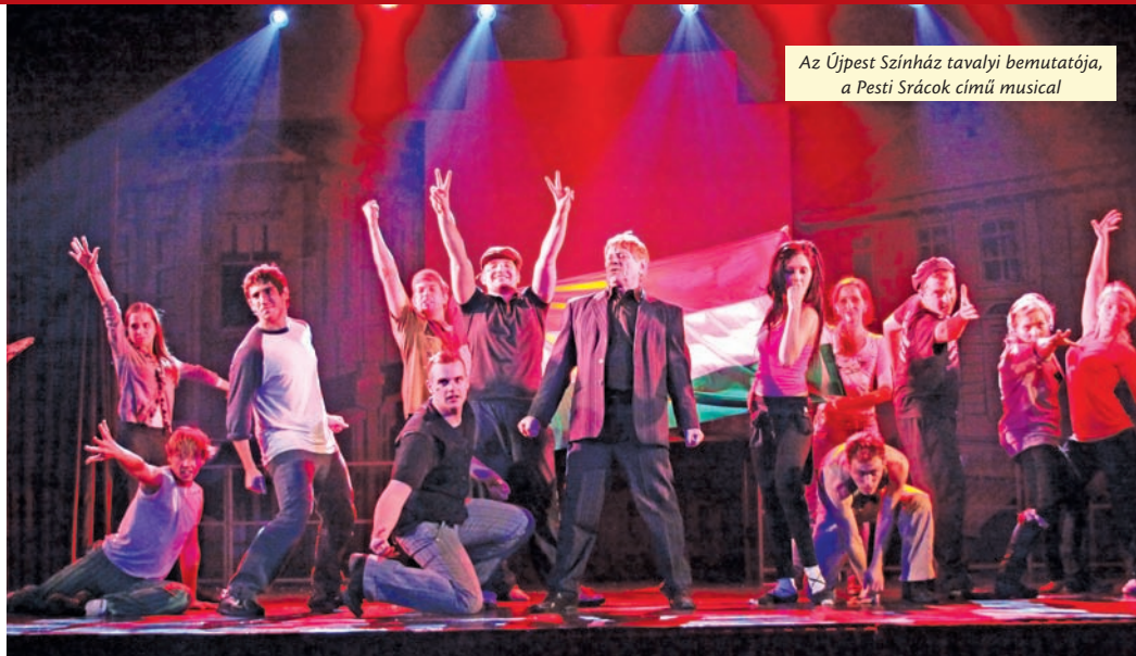
Az Újpest Színház tavalyi bemutatója, a Pesti Srácok című musical

pesti Ifjúsági Sport- és Szabadidőközpont összevonásával jön létre, vagyis nem zárt be egyetlen intézmény sem.