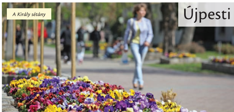
A Király sétány