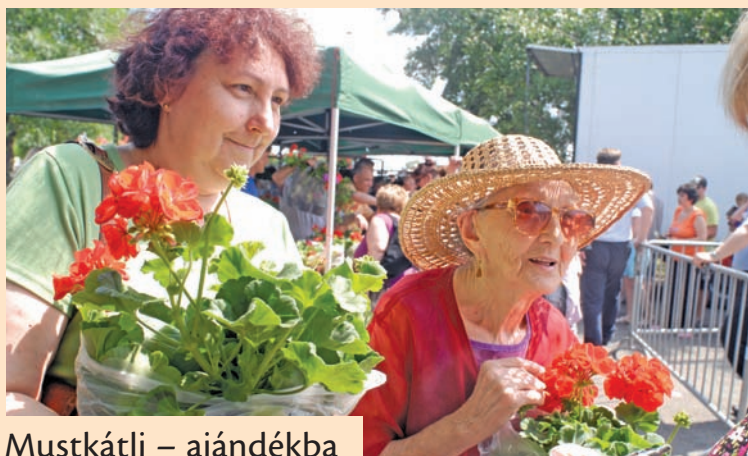
Mustkátli – ajándékba

A kialakításkor a parkolást is át kell gondolni, ugyanis keresztmetszetileg nem igazán lehet hozzányúlni az útszakaszhoz helyhiány miatt. A Görgey utcai beruházás komoly – akár az 1 milliárd forintot is meghaladó – költséget jelent, de ezt azonban számos tényező még befolyásolhatja. antosa