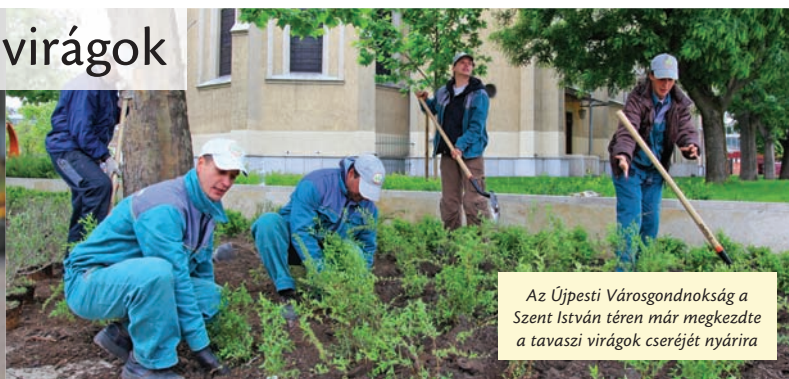
Az Újpesti Városgondnokság a Szent István téren már megkezdte a tavaszi virágok cseréjét nyárra