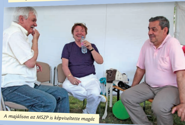
A majálison az MSZP is képviseltette magát