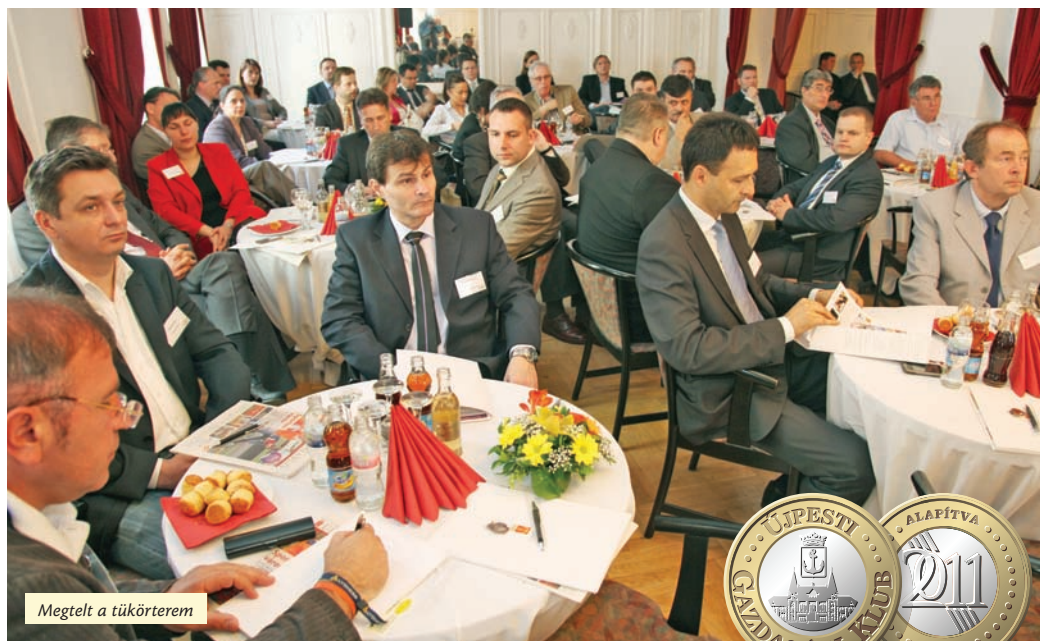
Megtelt a tükörterem