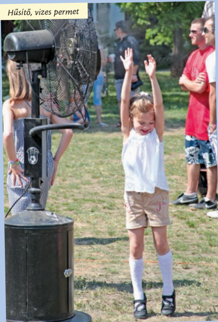
Hűsítő, vizes permet