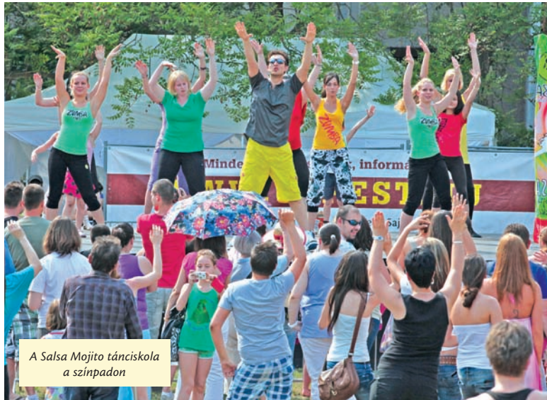
A Salsa Mojito tánciskola a színpadon

Minden korosztály számára érdekes programok várták a Semsey parkba látogatókat május elsején egész nap folyamán. A legkisebbek számára a Doka Dance Stúdió táncosai és a Helen Doron Nyelviskola tanulói adtak műsort a színpadon. A majális hangulatáról a nosztalgia vidámpark, az elektromos kisautó, a kézműves sátor és gyerekek kedvencei, a Rex Állatsziget kis lakói gondoskodtak. A klaszikus elemek, mint a májusfa állítása mellett kívánságokat is szép számban szalagoztak fel a majálisozók.