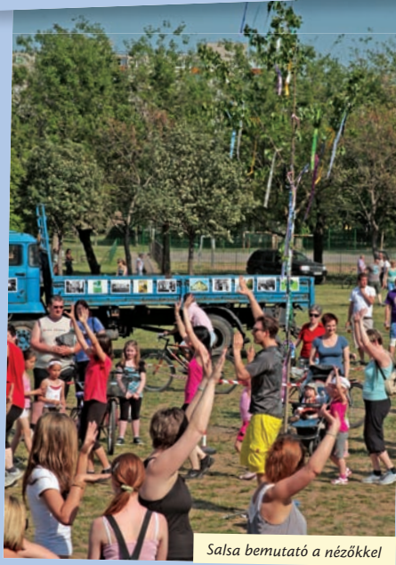
Salsa bemutató a nézőkkel