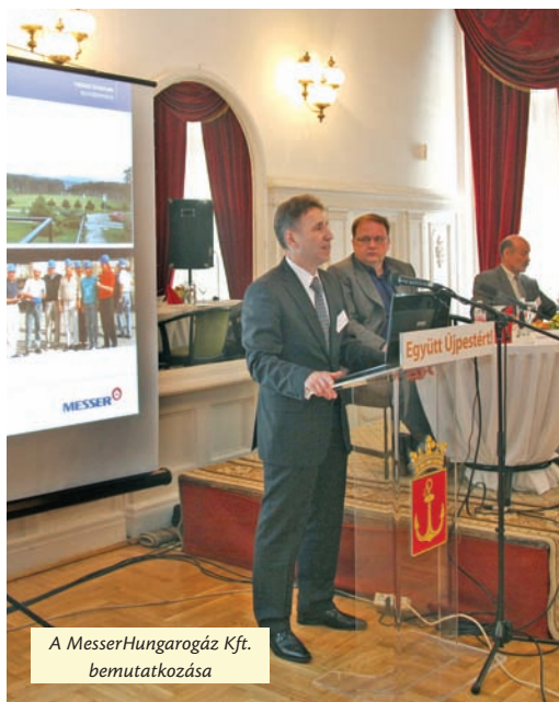
A MesserHungarogáz Kft. bemutatkozása