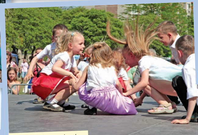
Kicsinyek műsora a színpadon