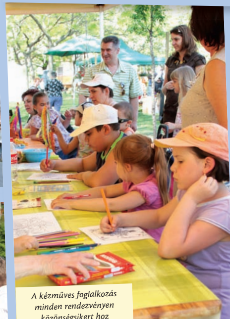
A kézműves foglalkozás minden rendezvényen közönségsikert hoz