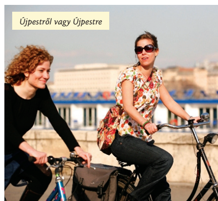
Újpestről vagy Újpestre

Az április 21-i Sportparty gazdag programja egy újjal bővült, amelyre várják a jelentkezőket. Az önkormányzat, csatlakozva a Nemzeti Fejlesztési Minisztérium és a Magyar Kerékpáros Klub Bam! – Bringázz a munkába! mozgalmához, a sportnap apropóján is népszerűsíti, hogy aki teheti, bringával menjen a munkahelyére.