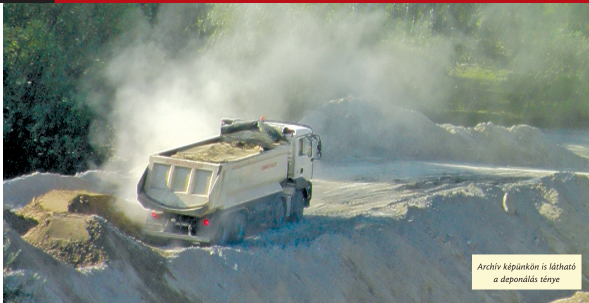
Archív képünkön is látható a deponálás ténye

Nagy port kavart az elmúlt év őszén a Megyeri úti köztemető területére hordott jelentős mennyiségű zúzott törmelék. Az újpesti önkormányzat és a polgármester nyomatékos intézkedésének hatására a családok nyugalma erősen zavaró föld és törmelék, most már másodfokon is jogerősen, elszállítandó!