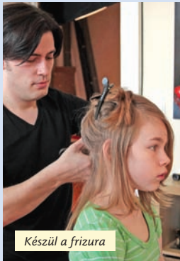
Készül a frizura