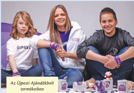
Az Újpesti Ajándékbolt termékeiben