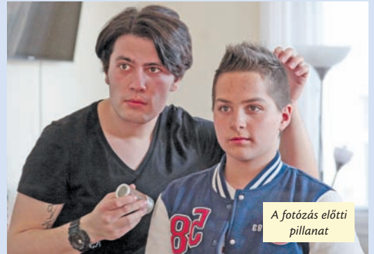
A fotózás előtti pillanat