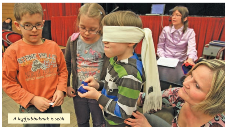
A legifjabbaknak is szólt