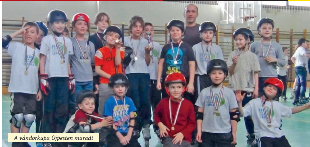
A vándorkupa Újpesten maradt

Először csak ügyességi, aztán gyorsasági görkorcsolyáztunk, de azt már terepen. Utána jött a görhoki, a görkosár, a lányoknak pedig a táncos görkorcsolya. Olyannyira, hogy számos jótékony hatását figyelembe véve be is vettük a helyi testnevelés tan-