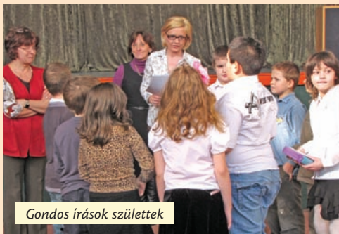
Gondos írássok születtek

A megmérettetés nagyon fontos alkalom volt a résztvevő gyerekek számára, hiszen lehetőségük nyílt megmutatni tehetségüket. Nagyon sok szép, gondos írás született.