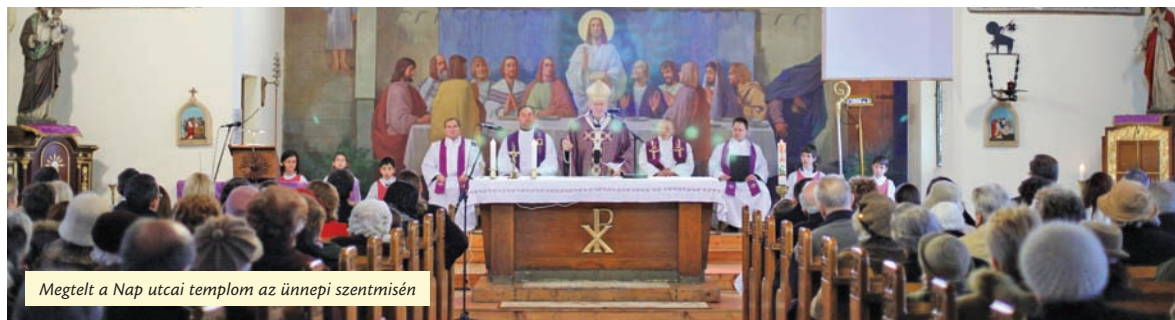
Megtelt a Nap utcai templom az ünnepi szentmisén

Dr. Erdő Péter gyakori vendége Újpestemnek. A tavalyi Városnapok idején az Egek Királynéja Főplébánián járt, találkozott a hívekkel, majd megáldotta a piac kereskedői által, a rászorulóknak felajánlott terményeket.