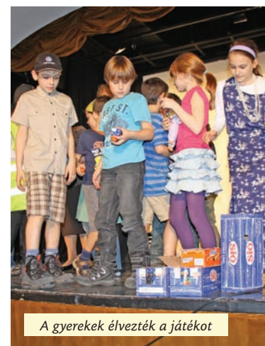
A gyerekek élvezték a játékot