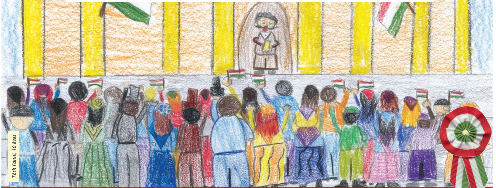
Tóth Fanni, 10 éves

Nemzeti ünnepünk előtt óvodásokat és iskolásokat kért arra az Újpesti Sajtó Kft., hogy rajzolják le a szabadságot. A díjazottak rajzaival hívjuk olvasóinkat közös megemlékezésre március 15-én. – 5. oldal