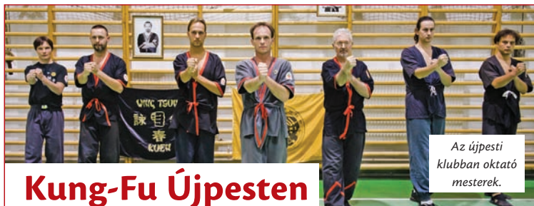
Az újpesti klubban oktató mesterek.