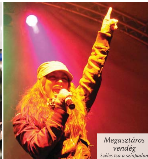
Megasztáros vendég Széles Iza a színpadon