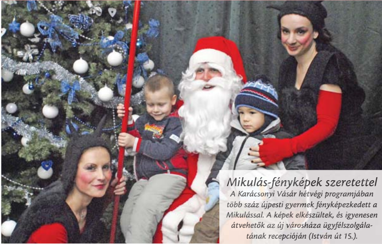
Mikulás-fényképek szeretettel A Karácsonyi Vásár hétfői programjában több száz újpesti gyermek fényképezkedett a Mikulással. A képek elkészültek, és ingyenesen átvehetők az új városháza ügyfélszolgálatának recepcióján (István út 15.).