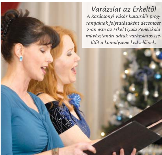
Varázslat az Erkelről A Karácsonyi Vásár kulturális programjainak folytatásaként december 2-án este az Erkel Gyula Zeneiskola művészstanári adtak varázslatos ízeletet a komolyzene kedvelőinek.