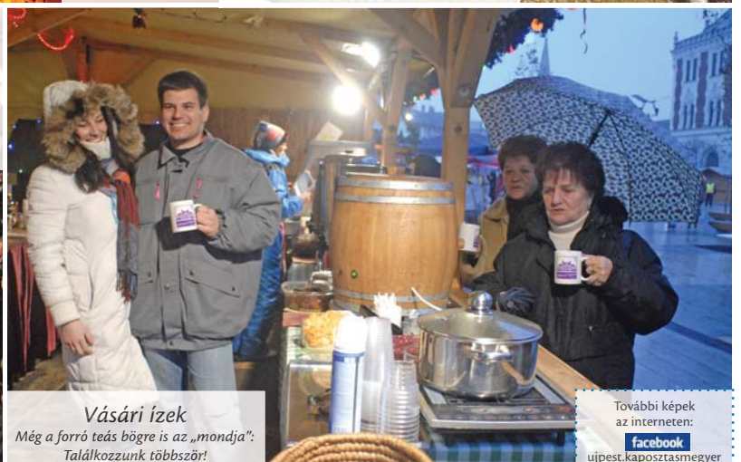
Vásári ízek Még a forró teás bögre is az „mondja”: Találkozzunk többször!

További képek az interneten: Facebook ujpest.kapoztasmegyer