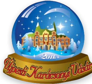
A Karácsonyi Vásár második hétvégéje is sok újpestit vonzott a Szent István téri és városházi programokra, reggeltől estig.