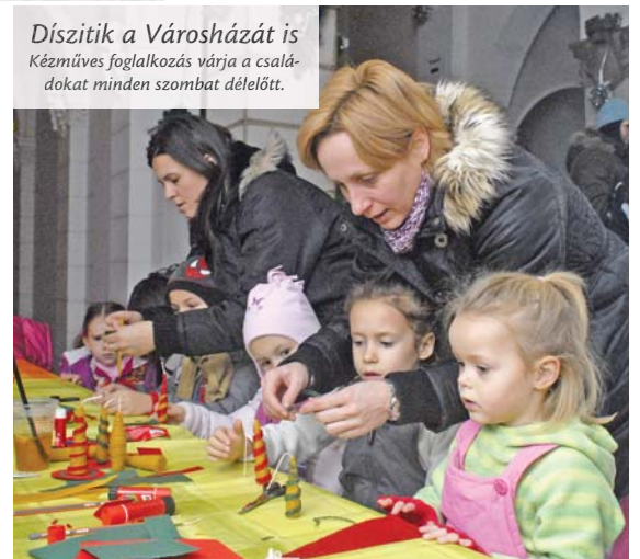
Díszítik a Városházát is Kézműves foglalkozás várja a családokat minden szombat délelőtt.