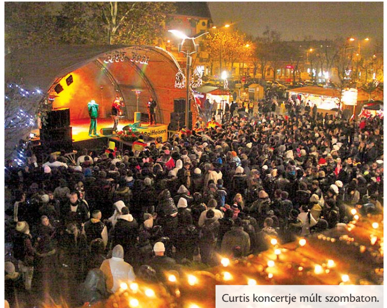
Curtis koncertje múlt szombaton.