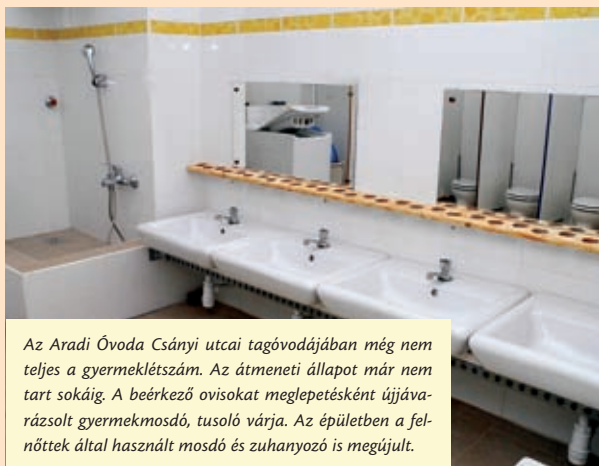
Az Aradi Óvoda Csányi utcai tagóvodájában még nem teljes a gyermeklétszám. Az átmeneti állapot már nem tart sokáig. A beérkező ovisokat meglepetésként újjávarázsolt gyermekmosdó, tusoló várja. Az épületben a felnőttek által használt mosdó és zuhanyozó is megújult.