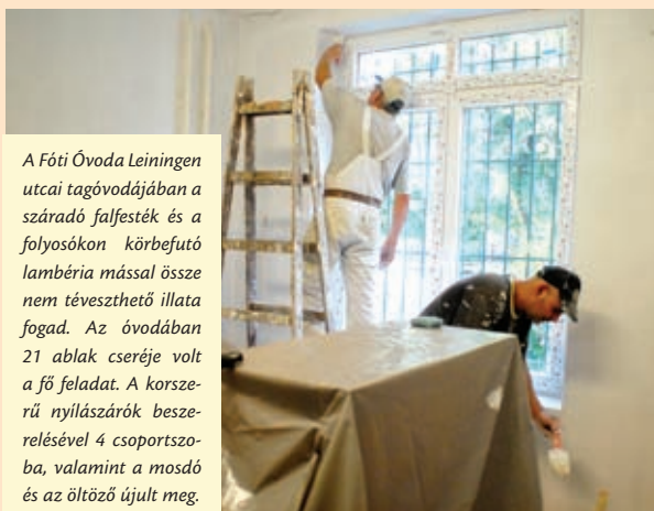
A Főti Óvoda Leiningen utcai tagóvodájában a száradó falfesték és a folyosókon körbefutó lambéria mással össze nem téveszthető illata fogad. Az óvodában 21 ablak cseréje volt a fő feladat. A korszerű nyílászárók beszerelésével 4 csoportszoba, valamint a mosdó és az öltöző újult meg.

– A műszaki átadások folyamatosak. Augusztus utolsó hetében mindenütt levonulnak a mesteremberek, hogy alapos takarítást követően szeptember elsejétől a diákok és a pedagógusok egyaránt az új tanévre figyelhessenek. – B. K.