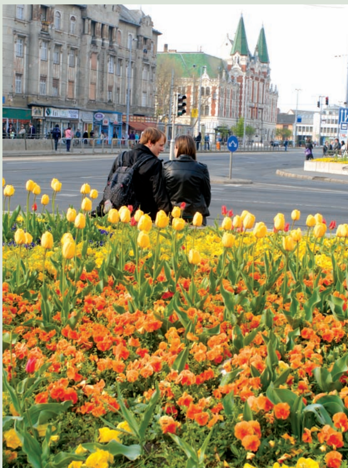
A szerelmeseket is kicsalta a tavaszi zsongás, virágba borulás az újpesti terekre.

ÉRTÉKELTÉK A FOTÓPÁLYÁZATOT Lezárult Újpest Önkormányzata és az Újpesti Sajtó Kft. fotópályázatának első fordulója. A zsűri a hét elején kiválasztotta a második forduloba kerülő képeket. Bár igen sok jelentkező küldte be alkotásait, a szakmai testület nem talált minden kategóriában elegendő számú és színvonalú pályamunkát. A sikerrel szereplő fotósok a napokban kapnak értesítést. (un)