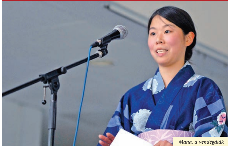
Mana, a vendégdiák

Sikeres Babits-gyűjtés a földrengés áldozatainak