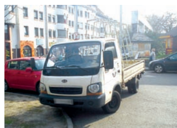
Jellemző helyzet a Munkásotthon utcánál. Szabálytalán módon az úttestet használják parkolóknak.

Rádi Attila alpolgármester az Újpesti Naplónak elmondta, a felmérés célja az, hogy megtudják, milyen arányban használják a kerületben lakók illetve az Újpesten kívülről érkezők az újpesti parkolóhelyeket. Az adatokból ki fog derülni, hogy az autósok mely napszakban, milyen céllal – alkalmi ügyintézés, állandó lakhely, vagy P+R parkolás miatt – parkolnak az adott utcában. A felmérés pontosan megmutatja azt is, hogy a vizsgált területen az adott napszakban milyen sűrűséggel cserélődnek a parkolóhelyeket használó autók.