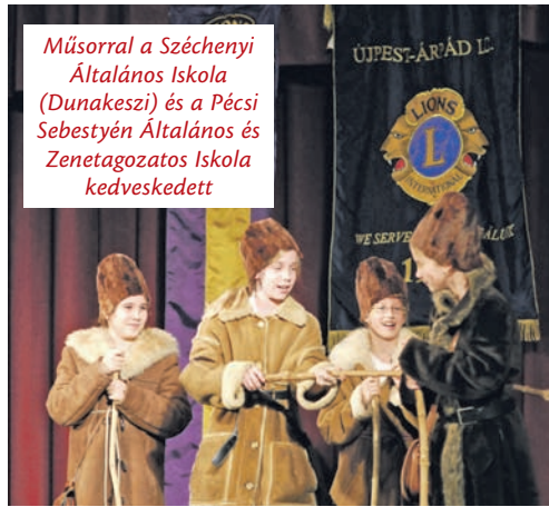
Műsorral a Széchenyi Általános Iskola (Dunakeszi) és a Pécsi Sebestyén Általános és Zenetagozatos Iskola kedveskedett

Nem sokkal két óra előtt már minden készen állt az Ady Endre Művelődési Központban az újpesti kisdíjak fogadására. Elkészültek az ajándécsomagok. Saly Péter a Lion's Újpest – Árpád Club el-