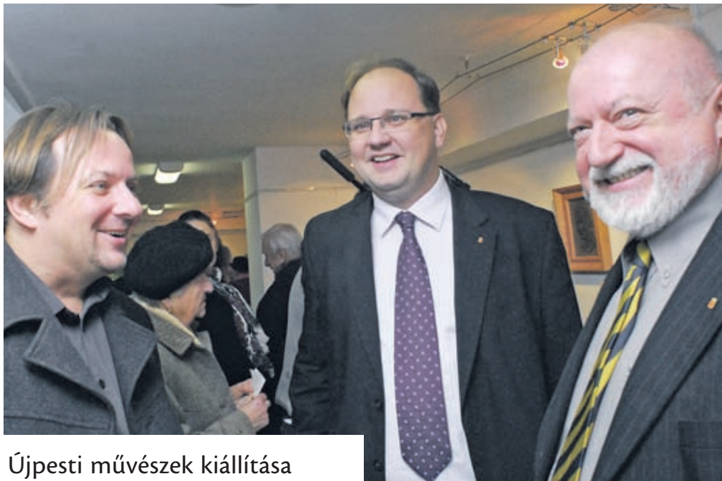
Újpesti művészek kiállítása