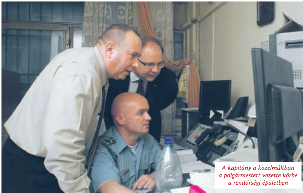
A kapitány a közelmúltban a polgármestert vezette körbe a rendőrségi épületben