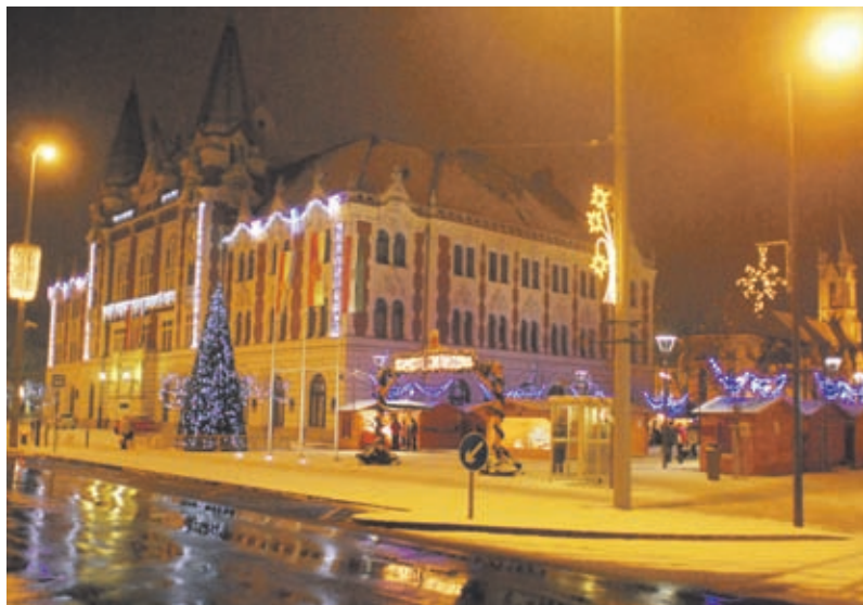
Újpesti Karácsony 2010.