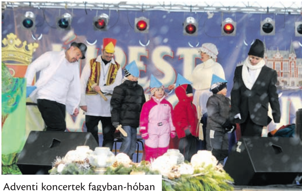
Adventi koncertek fagyban-hóban