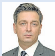
7. számú egyéni választókerület: BARTÓK BÉLA (Fidesz-UE)