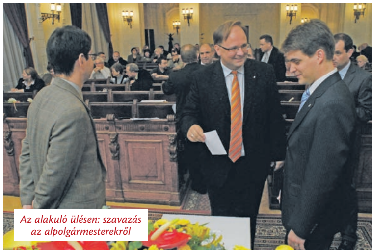
Az alakuló ülésen: szavazás az alpolgármesterekről

A család és a velük töltött idő már nehezebb kérdés. Egy család akkor lehet boldog, ha a benne élők egyenként is boldogok. Ezt a boldogságot pedig nap mint nap újra kell építeni. Néha küzdünk, néha versenyt futunk az idővel, de a megoldás mindig bennünk rejlik. Szeretnék még több időt tölteni velük. Nem csak a legnagyobb csoda az életemben gyermekeim cseperedése, de ők és feleségem jelentik a feltöltődést, belőlük merítek erőt az előttem tornyosuló feladatokhoz.