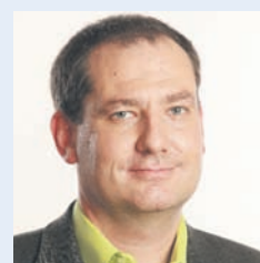
PERNECKY LÁSZLÓ (LMP)