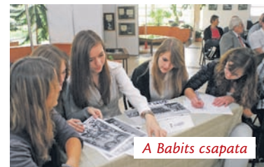
A Babits csapata