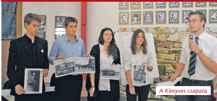
A Könyves csapata