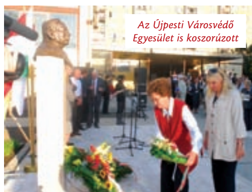
Az Újpesti Városvédő Egyesület is koszorúzott