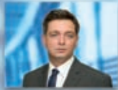
Bartók Béla 7. választókerület