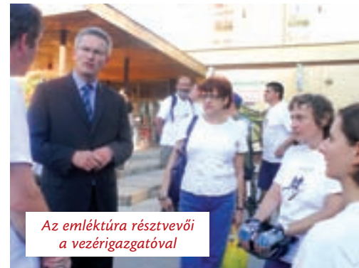
Az emléktúra résztvevői a vezérigazgatóval

Minden születésnap annál felejthetlenebb minél több gyertya ragyogja be az ünnepelt arcát. Ezért köszönöm, hogy meghívtak erre a jeles évfordulóra, a szoboravatóra és osztozhatom az Önök örömeiben – mondta az ünnepség szónoka. – Úgy gondolom, a Chinoin gyár példaértékű üzenetet hordoz Újpesten. A harmadik évezred üzenetét. Érdemes nagy terveket szőni, szabad merészeket álmodni, mert ha mindennap törekszünk arra, hogy felülmúljuk tegnapi önmagunkat, akkor álmaink valóra fognak válni.