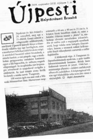
Nyitólapon és belső címlapon a 2010. szeptember 3-án megjelent Újpesti Helytörténeti Értesítő 3. számának címlapja. A képen látható a Tunggram gyár épülete, amely a lap egyik fő témáját képezi.

Az Újpesti Helytörténeti Értesítő térítésmentes példányai korlátozott számban átvehetőek az Újpesti Helytörténeti Gyűjteményben, az Ady Endre Művelődési Központban , az újpesti Polgármesteri Hivatalban , illetve Káposztásmegyeren a Karinthy György ÁMK-ban .