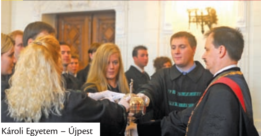
Károli Egyetem – Újpest