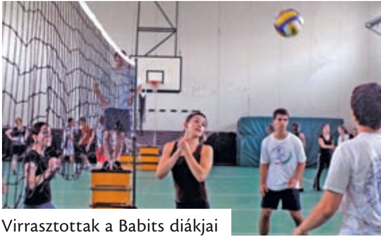
Virrasztottak a Babits diákjai