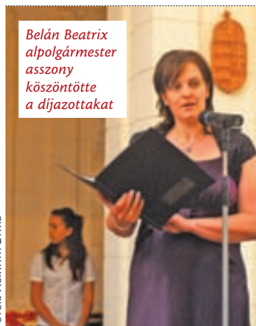
Belán Beatrix alpolgármester asszony köszöntötte a díjazottakat

Hat felnőtt és huszonhárom diák részesült ebben az évben az újpesti önkormányzat által alapított kitüntetésekben, az Újpest Gyermekéiért díjban, és az Újpest Kiváló Tanulója, az Újpest Kiváló Diáksportolója, valamint a Kiváló Diákközösségi Munkáért odaítélendő elismerésekben. A kitüntetések átadására hagyományosan a gyermeknap és a pedagógusnap apropóján került sor, ezúttal június 4-én a városháza dísztermében.