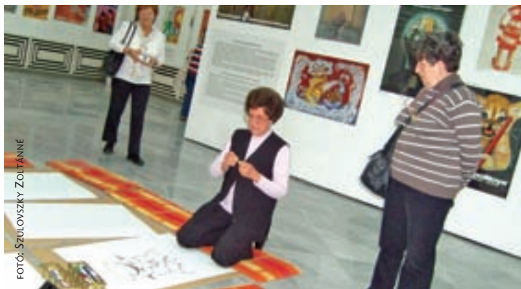
FOTÓ: SZULOVSKY ZOLTÁNNÉ

A másik, hozzánk közel álló kiállítás címe a „Plakátok a szocializmusban” címet viselte. Az „Utca képeskönyve” az 1945. és az 1989. közötti időszak plakátjait, a vetítoszobában