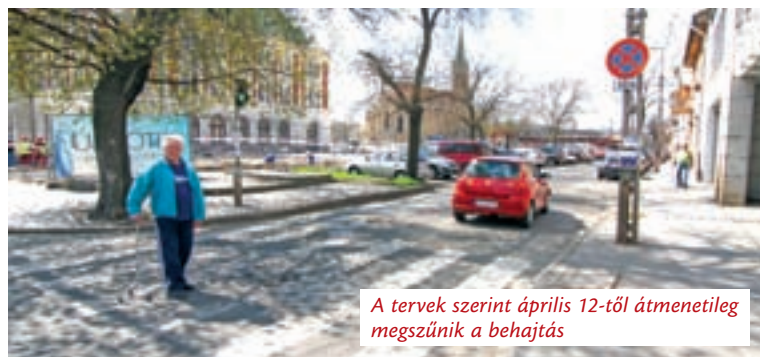
A tervek szerint április 12-től átmenetileg megszűnik a behajtás