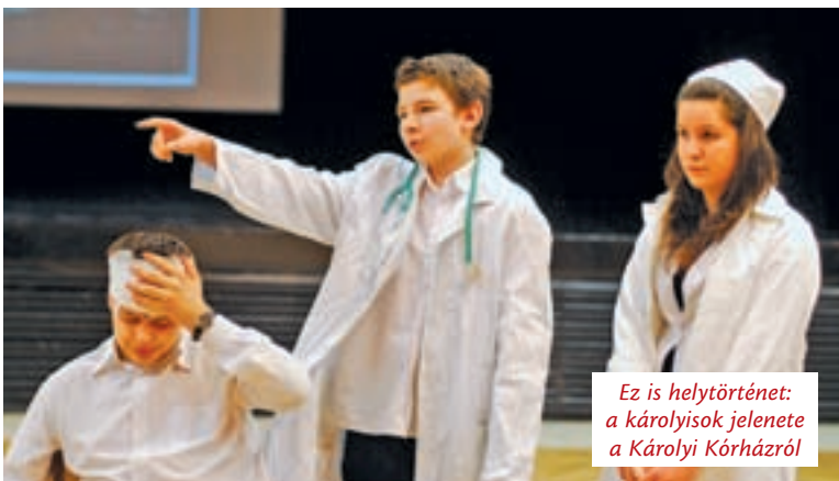
Ez is helytörténet: a károlyisok jelenete a Károlyi Kórházról

Közel húsz éves hagyománya van annak, hogy az Újpesti Helytörténeti Alapítvány vetélkedő meghirdetésével ösztönzi arra az újpesti diákokat, hogy minél többet tudjanak meg lakóhelyük múltjáról és jelenéről. Páratlan évben a középiskolások, páros évben az általános iskolák csapatai mérkőznek meg egymással.